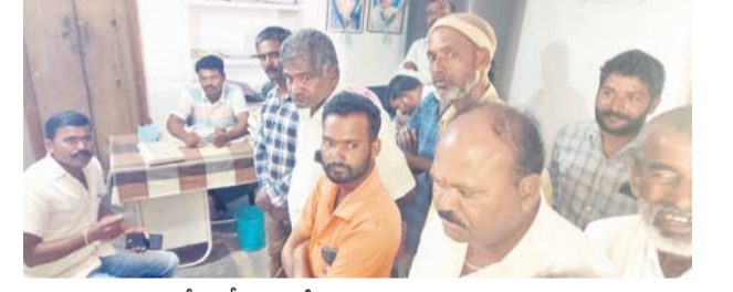
వెల్లండ బీఎంసీయూలో నిరసన తెలుపుతున్న పాడి రైతులు

పోస్ట్ మాస్టర్ సస్పెన్షన్ • రైతు ఫిర్యాదుతో అధికారుల విచారణ • అలంపూర్లో 1,200 పోస్టులు పెండింగ్లో ఉన్నట్లు గుర్తింపు గట్టు, అక్టోబర్ 10 : పచ్చని పోస్టులన్నీ తన వద్ద ఉంచుకొని పోస్టుమాస్టర్ ఇబ్బంది దుబుకు గురిచేస్తున్నాడని మండలంలోని అలంపూరుకు చెందిన పోస్ట్ మాస్టర్లపై ఓ రైతు ఉన్నతా డారులకు ఫిర్యాదు చేశాడు. పోస్టులకు, అధికారులు, పోస్టులకు ఇలా పోస్టు వచ్చిన వాటిని వినియోగ దారులకు వ్యయం లేదని తెలిపారు. ఈ విషయంపై గురువారం జిల్లా పోస్టల్ అధికారి విజయ జ్యోతి గ్రామానికి చేరుకొని విచారణ చేపట్టారు. దాదాపు 1,200 పోస్టులు పోస్టుమాస్టర్ వద్ద ఉన్నట్లు గుర్తించారు. నెల తరువడి పంపిణీ చేయకపోవడంతో పోస్టుమాస్టర్లను సస్పెండ్ చేస్తూ ఉత్తర్వులు జారీ చేశారు.