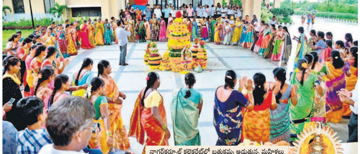
నాగరకర్నూల్ కలెక్టరేట్లో బతుకమ్మ ఆడుతున్న మహిళలు