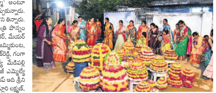
గోదావరిఖనిలోని ఎల్ టీ నగర్లో..