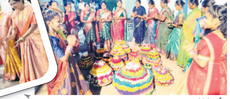
కరీంనగర్: ఎమ్మెల్యే గంగుల నివాసంలో..