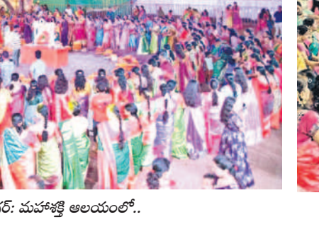
కరీంనగర్: బతుకమ్మలను నిమజ్జనం చేస్తున్న మహిళలు