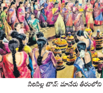
కరీంనగర్: బతుకమ్మలను నిమజ్జనం చేస్తున్న మహిళలు