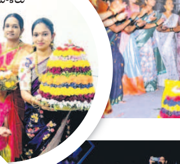
కరీంనగర్లో బతుకమ్మతో మహిళలు