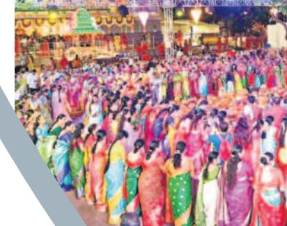
కరీంనగర్: బతుకమ్మ వేడుకల్లో మంత్రి పాస్టం ప్రభాకర్