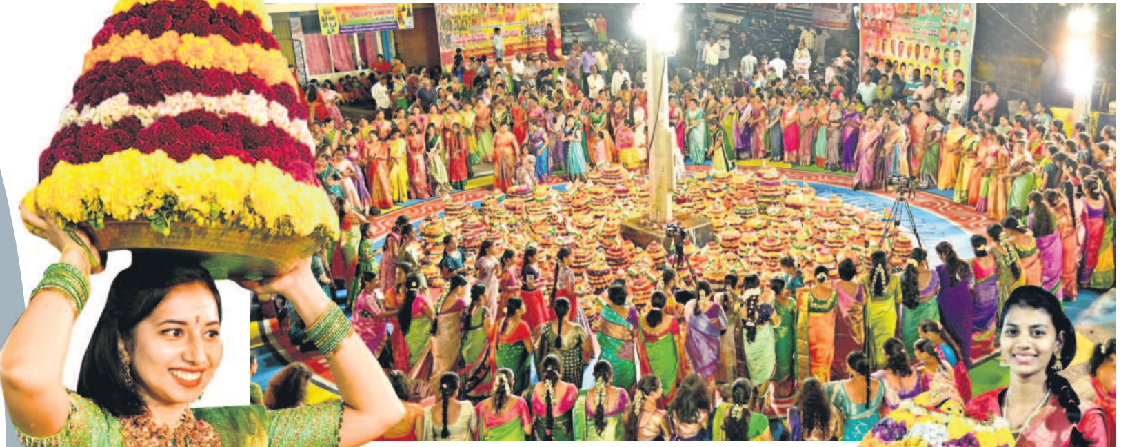
కరీంనగర్: రాంనగర్లో బతుకమ్మ ఆడుతున్న మహిళలు