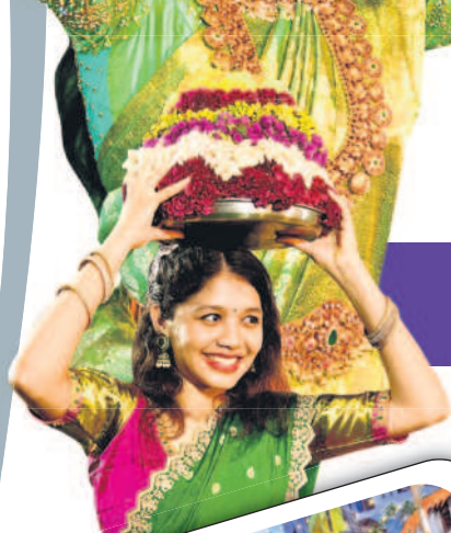
జగిత్యాలలో బతుకమ్మలతో వస్తున్న మహిళలు