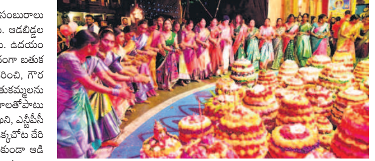
కరీంనగర్: జ్యోతిసగర్లోని గోపాలనగర్ చౌరస్తాలో బతుకమ్మ ఆడుతున్న మహిళలు