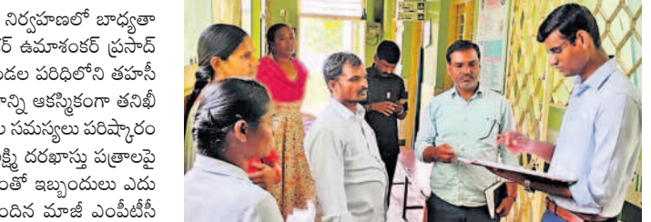
దవాఖాన నిబంధితో మాట్లాడుతున్న సబ్ కలెక్టర్ ఉమాశంకర్ ప్రసాద్

కొడంగల్, అక్టోబర్ 10: అధికారులు విధుల నిర్వహణలో బాధ్యతాయుతంగా మెలగాలిని తాండూరు సబ్ కలెక్టర్ ఉమాశంకర్ ప్రసాద్ సూచించారు. గురువారం బౌండాస్ మేట మండల పరిధిలోని తహసీల్దార్ కార్యాలయం, ప్రాథమిక ఆరోగ్య కేంద్రాన్ని ఆకస్మికంగా తనిఖీ చేశారు. తహసీల్దార్ కార్యాలయంలో భూముల సమన్వయ పరిష్కారం కావడంతో ఆలస్యం అవుతుందని, కల్యాణలక్ష్మి దరఖాస్తు పత్రాలపై గెజిట్ అధికారులు సంతకం చేయకపోవడంతో ఇబ్బందులు ఎదురవుతున్నాయని మెట్లకుంట్ల గ్రామానికి చెందిన మాజీ ఎంపీటీసీ సర్పంచులు నాయుడు సబ్ కలెక్టర్ కు తెలిపారు. స్పందించిన ఆయన ఎంపీటీసీతో అధికారుల జాబ్ చేయనున్నట్లు పేర్కొన్నారు. ఆనంతరం ప్రాథమిక ఆరోగ్య కేంద్రాన్ని పరిశీలించారు. ఒక్కో ఉద్యోగిలో మాట్లాడి వివరాలు అడిగి తెలుసుకున్నారు. ఆయంట్ వైద్యాధికారి గోపాల్ అందుబాటులో లేకపోవడంతో సబ్ కలెక్టర్ ఆసంతృప్తి వ్యక్తం చేశారు. రోగులకు సకాలంలో వైద్య సేవలు అందించేలా ప్రతి ఒక్కరూ సమ