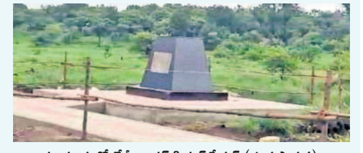
పూడూరులో నేపీ రాడార్ సిగ్నల్ స్టేషన్ (శంకుస్థాపన) శిలాపలక నిర్మాణం కోసం ఏర్పాటు చేసిన దిమ్మె

పూడూరు, అక్టోబర్ 10: దామగుండ రామలింగేశ్వరస్వామి ఆలయ ప్రాంతంలో నేపీ సిగ్నల్ స్టేషన్ నిర్మాణం కోసం శంకుస్థాపన చేసేందుకు సంబంధిత ఉన్నతాధికారులు పనులను ముమ్మారుం చేశారు. పూడూరు మండల పరిధిలోని దామగుండం ఆలయ ప్రాంతంలో 2,900 ఎకరాల అటవీ భూమిని నేపీ సిగ్నల్ రాడార్ స్టేషన్ ఏర్పాటు కోసం 12 ఏకరాల స్థలం విడిచిపెట్టారు. ఈ స్థలం 15 నాటి నేపీ రేవంత్ రెడ్డి, కేంద్ర మంత్రులతో పనుల ప్రారంభోత్సవానికి శిలా పలక ఏర్పాటుతో పాటు, భూమి పూజ చేసేందుకు వికారాబాద్-దామగుండం మధ్యలో బీకులబీడుతండా సమీపంలో సంబంధిత నేపీ అధికారులు ఏర్పాటు చేస్తున్నారు.