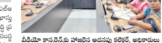
వీడియో కాన్ఫరెన్స్ హాజరైన అదనపు కలెక్టర్, అధికారులు