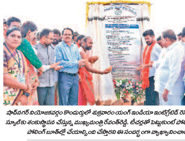
ఫాదర్ గర్ నియోజకవర్గం కొందుల్లో శుక్రవారం యంగ్ ఇండియా ఇంటిగ్రేటెడ్ రెసిడెన్షియల్ స్కూల్కు శంకుస్థాపన చేస్తున్న ముఖ్యమంత్రి రేవంత్ రెడ్డి. టీచర్లతో పెట్టుకుంటే పోలింగ్ లోజున పోలింగ్ బూత్లో చేయించి చేస్తారని ఈ సందర్భంగా వ్యాఖ్యానించారు