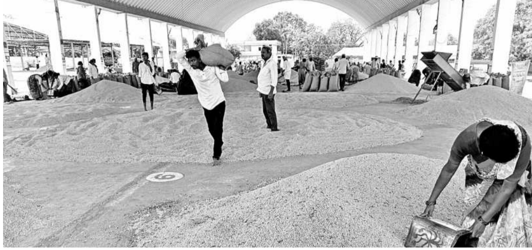
అదిలాబాద్ మార్కెట్ యార్డుకు వచ్చిన సోయాటీస్

హైదరాబాద్/అదిలాబాద్, అక్టోబర్ 11 (నమస్తే తెలంగాణ): మార్కెట్లో సోయాటీస్ ధర భారీగా పడిపోయింది. మధ్యతర ధర క్వింటాలుకు రూ. 4892 ఉండగా మార్కెట్లో కేవలం రూ. 3500 నుంచి రూ. 4వేల లోపే ధర పలుకుతున్నది. ఎన్నికల సమయంలో పంట మధ్యతర ధరకు అదనంగా రూ. 450 బోనస్ ఇస్తామని హామీ ఇచ్చిన కాంగ్రెస్ పార్టీ ఇప్పుడు బోనస్ సంగతి దేవుడెవ్వరు కనీసం మధ్యతర ధరకు కొనుగోలు చేసేందుకు కూడా వెనకబడి వేస్తుండడంపై విమర్శలు మెల్లమెత్తుతున్నాయి.