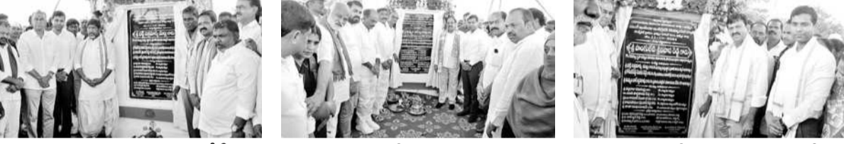
శిలాఫలకాన్ని అవిష్కరిస్తున్న డిప్యూటీ సీఎం భూమి పూజ చేస్తున్న మంత్రి తుమ్మల శంకుస్థాపన చేస్తున్న మంత్రి పాంగులెటి

బోనకల్లు/రఘునాథపాలెం/ఖమ్మం రూరల్, అక్టోబర్ 11 : అంతర్జాతీయ ప్రమాణాలతో నాణ్యమైన విద్య అందించడమే తమ ప్రభుత్వ లక్ష్యమని ఉప ముఖ్యమంత్రి మల్ల పుట్టిపాటి కృష్ణారావు పేర్కొన్నారు. మన విద్యార్థులను ప్రపంచ స్థాయి మానవ పనులుగా తయారు చేయడమే లక్ష్యంగా తమ ప్రభుత్వం చర్యలు తీసుకుంటోందని అన్నారు. 'యంగ్ ఇండియా' వీరిని కాంగ్రెస్ ప్రభుత్వం ఏర్పాటు చేస్తున్న ఇంటిగ్రేటెడ్ గురుకుల పాఠశాలలో భాగంగా ఖమ్మం జిల్లాలో మూడు స్కూళ్ళ నిర్మాణాలకు శుభ్రం రం శంకుస్థాపనలు జరిగాయి. జిల్లాకు చెందిన ముగ్గురు మంత్రులు తమ సొంత నియోజకవర్గాల్లో వీటిని ఏర్పాటు చేస్తున్నారని, మధ్య నియోజకవర్గాలలోని బోనకల్లు మండలం గోవిందాపురం (ఎల్) గ్రామంలో ఉప ముఖ్యమంత్రి మల్ల పుట్టిపాటి కృష్ణారావు, ఖమ్మం నియోజకవర్గాలలోని రఘునాథపాలెం మండలం కేంద్రంలో రాష్ట్ర వ్యవసాయ శాఖ మంత్రి తుమ్మల నాగేశ్వరరావు, పాలేరు నియోజకవర్గాలలోని ఖమ్మం రూరల్ మండలం పాస్చికల్లో రాష్ట్ర రెవెన్యూ శాఖ మంత్రి పాంగులెటి శ్రీనివాసరెడ్డి ఈ రెనిడిన్సులలో స్కూళ్ళ భవన నిర్మాణాలకు భూమి పూజ చేశారు.