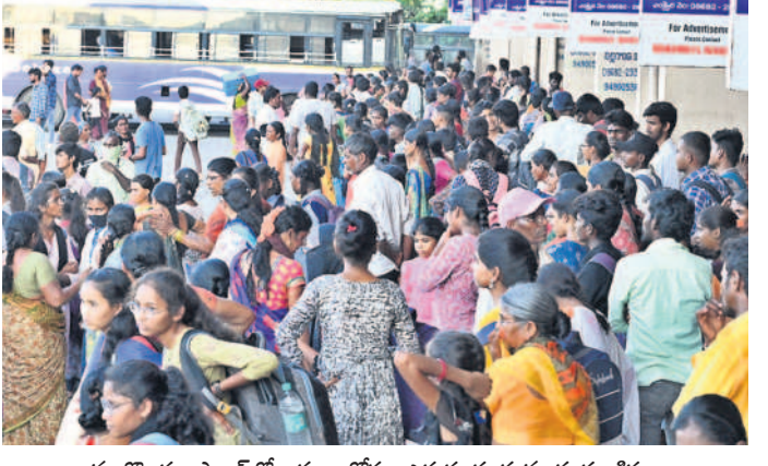
నల్లగొండ బస్టాండ్లో బస్సుల కోసం ఎదురు చూస్తున్న ప్రయాణికులు

సరిపడా అందుబాటులో లేని ఆర్టీసీ బస్సులు ప్రైవేట్ వాహనాలను ఆశ్రయించిన ప్రజలు