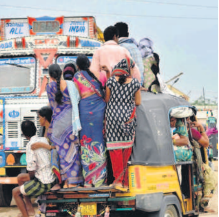
నల్లగొండలో ఆటోలో ప్రయాణికుల ప్రయాణం

నల్లగొండ సిటీ, అక్టోబర్ 11 : దసరా పండుగ పూట సొంత గ్రామాలకు వెళ్లే వారు ప్రయాణానికి అవ్వనట్లు పడ్డారు. ఆర్టీసీ అధికారులు అదనపు బస్సులు ఏర్పాటు చేసినా అవి ప్రధాన రహదారులకు తప్ప గ్రామాలకు లేకపోవడంతో ఇబ్బందులు ఎదురయ్యాయి. చేసేదిలేక ప్రైవేట్ వాహనాలను సమ్మొకున్నారు. మహాత్మీ పథకంలో భాగంగా ఆర్టీసీ, ఎక్స్ ప్రెస్ బస్సుల్లో మహిళలు ఉచిత ప్రయాణం ఉండగా, ఆర్టీసీ అధికారులు ఆ బస్సులను తగ్గింపి డిలీక్ట్ బస్సులను ఎక్కువగా సడీమిస్టం డంట్ బస్సుల కోసం గంటల తరబడి ఎదురు చూడాల్సి వచ్చింది.