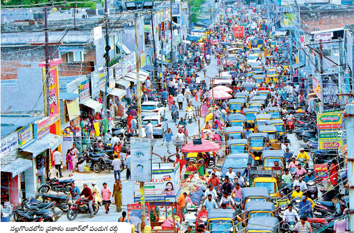
నల్లగొండలోని ప్రకాశం బజార్లో పండుగ రద్దీ

● జిల్లా వ్యాప్తంగా శమీ పూజకు ఏర్పాట్లు ● పల్లెలకు చేరుకున్న పట్నం