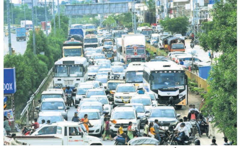
చౌటుప్పల్ పట్టణలో బారులుదీరిన వాహనాలు

5 నల్లగొండ, శనివారం 12 అక్టోబర్ 2024 SURYAPET