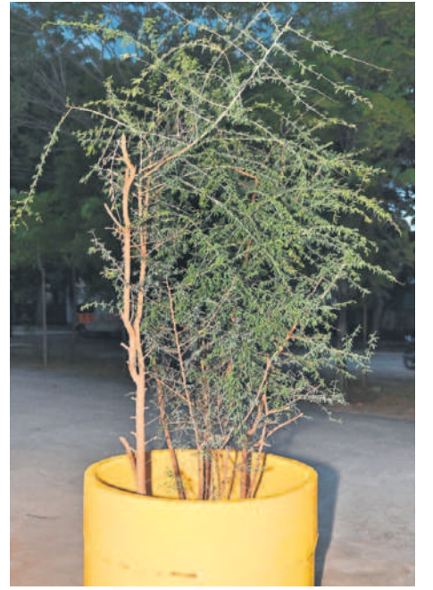
సూర్యాపేటలో జమ్మిచెట్టు వద్ద ఏర్పాట్లు