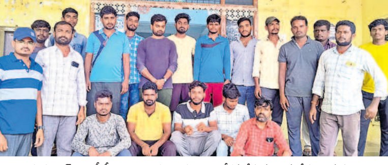
గుర్రంపోడి : ఎంపీడీఓ కార్యాలయం ఎదుట ఆందోళన చేస్తున్న చామలేడు గ్రామస్థులు

నల్లగొండ సిటీ, అక్టోబర్ 11 : దసరా పండుగ పూట సొంత గ్రామాలకు వెళ్లే వారు ప్రయాణానికి అవ్వనట్లు పడ్డారు. ఆర్టీసీ అధికారులు అదనపు బస్సులు ఏర్పాటు చేసినా అవి ప్రధాన రహదారులకు తప్ప గ్రామాలకు లేకపోవడంతో ఇబ్బందులు ఎదురయ్యాయి. చేసేదిలేక ప్రైవేట్ వాహనాలను సమ్మొకున్నారు. మహాత్మీ పథకంలో భాగంగా ఆర్టీసీ, ఎక్స్ ప్రెస్ బస్సుల్లో మహిళలు ఉచిత ప్రయాణం ఉండగా, ఆర్టీసీ అధికారులు ఆ బస్సులను తగ్గింపి డిలీక్ట్ బస్సులను ఎక్కువగా సడీమిస్టం డంట్ బస్సుల కోసం గంటల తరబడి ఎదురు చూడాల్సి వచ్చింది.