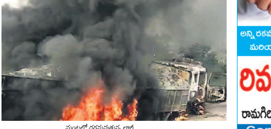
మంటల్లో దగ్ధమవుతున్న లారీ