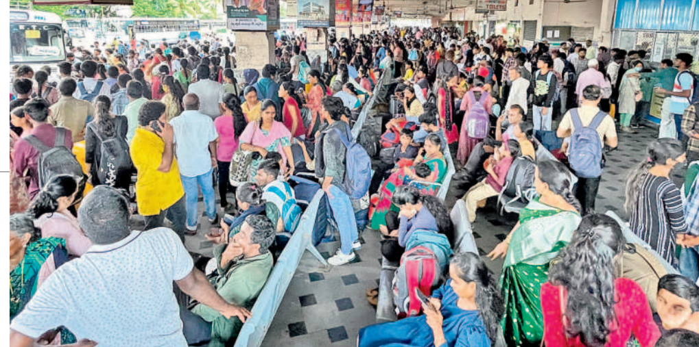
హనుమకొండ బస్ స్టేషన్లో బస్సుల కోసం వేచిచూస్తున్న ప్రయాణికులు