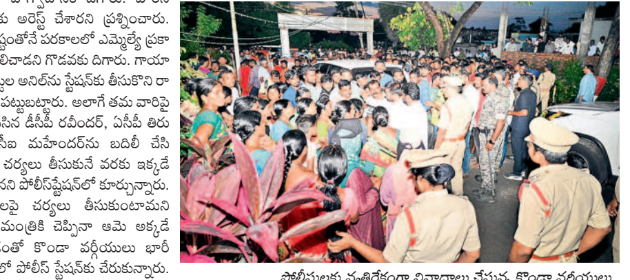
పోలీసులకు వ్యతిరేకంగా నివాదాలు చేస్తున్న కొండా వర్గీయులు

సీబి కుర్చీలో మంత్రి సురేఖ మంత్రి కొండా సురేఖ రాజ్యాంగ బద్ధ పదవిలో ఉండి కనీసం అలాంటి లెక్కలతో పోలీస్ స్టేషన్లో సీబి కుర్చీలో కూర్చున్నారు. ఏసీపీ, సీబి మంత్రి ముందు నిలబడి ఆమె ఆడి గిన ప్రభుత్వం సమాధానం చెప్పారు. డీసీపీ ఎదురుగా ఉన్న కుర్చీలో కూర్చుంటే.. మంత్రి మాత్రం సీబి కుర్చీలో కూర్చొని పోలీసులపై పెత్తనం చేయడం ఏమిటని స్థానికులు చర్చించు కుంటున్నారు.