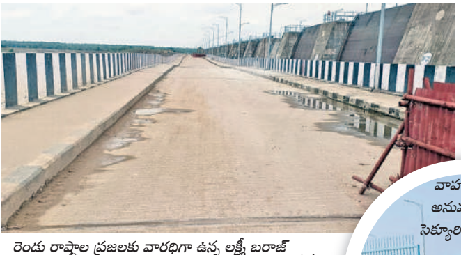
రెండు రాష్ట్రాల ప్రజలకు వారధిగా ఉన్న లక్ష్మీ బరాజ్