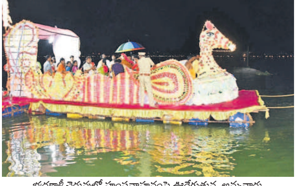
భద్రకాళి చెరువులో హనుమానంపై ఊరేగిన అమ్మవారు