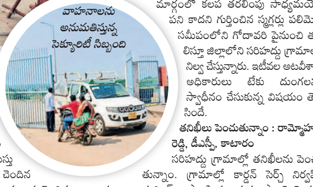
వాహనాలను అనుమతిస్సు సెక్యూరిటీ నిబ్బంది