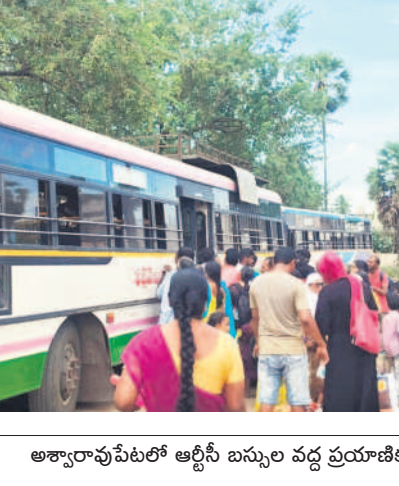
అశ్వారావుపేటలో ఆర్టీసీ బస్సుల వద్ద ప్రయాణికుల రద్దీ

డిఎస్సీ 2024 ఉపాధ్యాయులకు సంబంధించి పోస్టింగ్ ఇచ్చేందుకు ముందుగా 1:1 నిష్పత్తిలో జాబితాను ప్రదర్శించనున్నారు. స్కూల్ ఆఫ్ సైట్, ఎన్ జీటీ గ్రేడ్ టీచర్, లాంగ్ టైమ్ పీజీటీలు ఇలా అన్ని విభాగాల్లో 1:1 నిష్పత్తిలో జాబితాను ప్రకటించనున్నారు. డిసైలో కూడా విద్యార్థుల సంఖ్యకు అనుగుణంగా లేని మారుమూల ప్రాంతాల్లోని స్కూల్స్ కి ప్రాధాన్యత కల్పిస్తున్నారు. ఎర్రపాలెం, వేంసూరు, కారేపల్లి, మధిర వంటి మండలాల్లోని స్కూల్స్ ని జాబితాలో చేర్చారు. 520 మంది అభ్యర్థులకు 520 జాబితా జాబితాను విద్యాశాఖాధికారులు సిద్ధం చేశారు. డైరెక్ట్ కౌన్సిలింగ్ నిర్వహణకు ఆవసరమైన కంప్యూటర్లు, కౌన్సిలింగ్ ఆనంతరం వెంటనే పోస్టింగ్ ఇచ్చేందుకు ఏర్పాట్లు చేశారు.