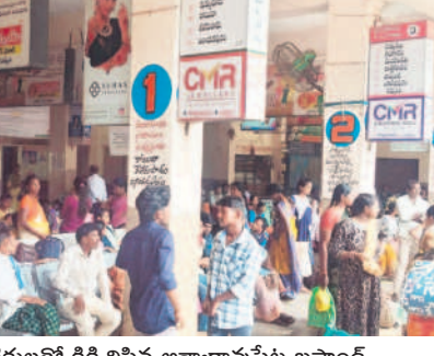
ప్రయాణికులతో కిక్కిరిసిన అశ్వారావుపేట బస్టాండ్

దసరా పండుగ కోసం జిల్లాలోని అంతర్గత సర్వీసులను కుదిరిన ఆర్టీసీ అధికారులు.. రాష్ట్ర రాజధాని హైదరాబాద్ కు అదనపు బస్సులను పెంచారు. దీంతో ఉమ్మడి జిల్లాలోని సోమవారం నాటి ప్రత్యేక బస్సుల్లో రూ.150 చొప్పున చార్జీలు విధించారు. ఇక ఇదే బస్సుల్లో 'మహాశక్తి' పథకం కింద మహిళా ప్రయాణికులను అనుమతించలేదు. ఒకవేళ మహిళా బస్సు ఎక్కినా వారి వద్ద నుంచి సెషల్ చార్జీల్లో 50 శాతం పనులు చేశారు. అంటే ప్రత్యేక సర్వీసుల్లో బస్సులు మధ్య రాకపోకల కోసం బస్సుల సంఖ్య అదేనాటికే తగ్గడంతో ప్రయాణికులు అరిగిన పడ్డారు. సెషల్ బస్సుల వేరిబు నడిపిన సర్వీసుల్లో 50 శాతం అదనపు చార్జీలను వసూలు చేశారు. ఉదాహరణకు.. రెండు పట్టణాల మధ్య మామూలు రోజుల్లో నాదారం ఎక్స్ ప్రెస్ బస్సుల్లో రూ.100