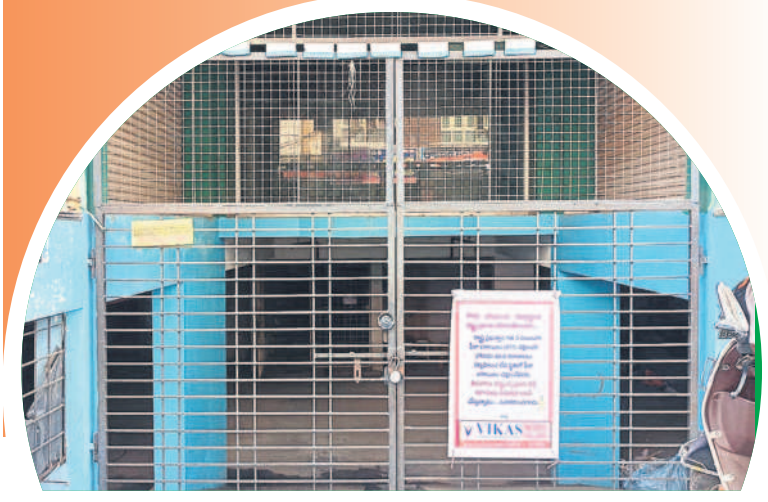
గోతుక తాళం వేసి బంద్ పాటిస్తున్న ఖమ్మం వికాస్ డిగ్రీ కళాశాల