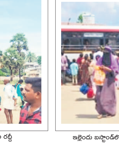
ఇల్లెం బస్టాండ్ లో ఆర్టీసీ బస్సు వద్ద వందలాది ప్రయాణికులు