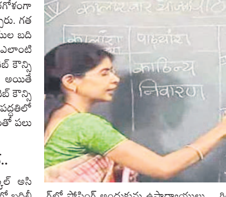
గోల్ పోస్టింగ్ అందుకున్న ఉపాధ్యాయులు ఈ నెల 18వ తేదీ నుంచి పాత కాలంలో రిపోర్ట్ చేసేలా విద్యాశాఖ అధికారులు జారీ చేయనున్నది.