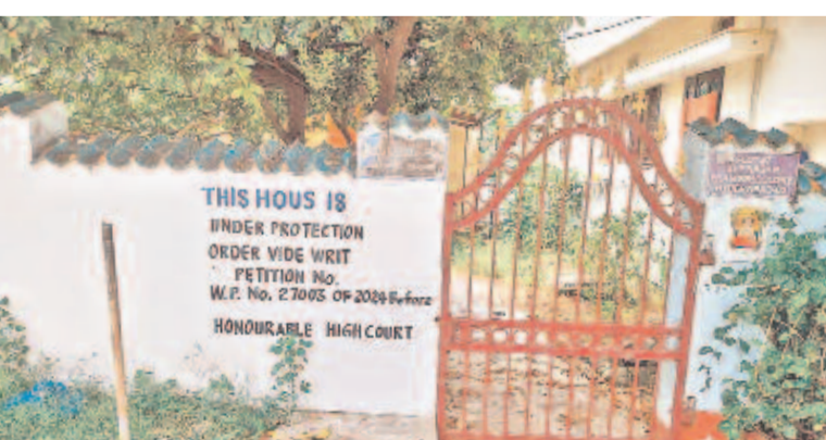
తమ ఇంటిని కూల్చుకుంటూ హైకోర్టు స్టే జారీ చేసినందుని పేర్కొంటూ గోదపై రాసిన ఓ ఇంటి యజమాని

కూల్చివేతల బాధితులకు హైకోర్టు భరోసా మూకుమ్మడిగా కోర్టును ఆశ్రయిస్తున్న ప్రజలు ఇప్పటికే 100 వరకు స్టేట్స్ కో ఉత్తర్వులు జారీ ఇండ్ల ముందు అతికించిన యజమానులు సర్కార్ కు మూసీ పరిపాలనకు బస్టిల షాకులు హైదరాబాద్ సీట్ బ్యూరో, అక్టోబర్ 14 (నమస్తే తెలంగాణ) : మూసీ ప్రక్షాళన పేరిట కూల్చివేతలకు సిద్ధమైన రేవంత్ రెడ్డి సర్కార్ కు మూసీ పరిపాలనకు ప్రజలు షాకులిస్తున్నారు. తమ ఇండ్లను కూల్చివేతలకు కోర్టులను ఆశ్రయిస్తున్నారు. రేపామాపో రెండో దఫా కూల్చివేతలకు ప్రభుత్వం సిద్ధమైన నేపథ్యంలో కోర్టుల ద్వారా స్టే ఆర్డర్ తెచ్చుకుంటున్నారు. మూసీ అభివృద్ధి పేరిట ప్రభుత్వం పేద, మధ్య తరగతి వర్గాలకు >2వ పేజీలో