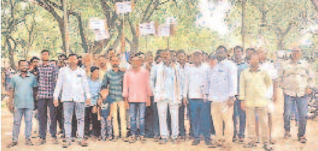
ప్రతిరోజూ 3,4 గంటలపాటు కరెంటు కోతలు విధిస్తుండటంతో వంటలు ఎండిపోతున్నాయని ఆసిఫాబాద్ జిల్లా కౌటాల మండల రైతులు ఆందోళన వ్యక్తం చేశారు. సోమవారం గుండామి నటిస్మిట్ వద్ద ధర్నా చేసిన రైతులు మార్కెట్ వరకు ర్యాలీ నిర్వహించారు.