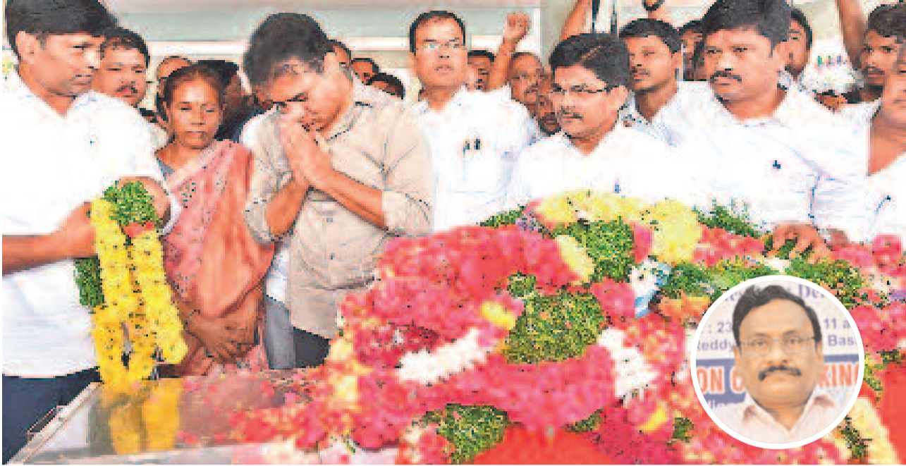
సోమవారం హైదరాబాద్లో ప్రాసెసర్ సాయిబాబా ఘాతకాయం వద్ద పుష్పగుచ్ఛం ఉంచి నివాళులర్పిస్తున్న బీఆర్ఎస్ వర్కింగ్ ప్రెసిడెంట్ కేటీఆర్, నేతలు