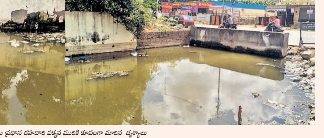
చాటింపేవూరు. మురికి నీరు రోడ్లపైకి వచ్చినప్పుడల్లా మోటార్లతో నాటిని తోడేసి చేతులు దులుపుకొంటున్నారు. నిత్యం మురుగునీరు నిలువ ఉండటంతో దోమలు, వందలకు నిలయంగా మారడంతో సీజనల్ వ్యాధుల బారిన పడుతున్నామని.. ఇప్పటికైనా అధికారులు, ప్రజాప్రతినిధులు స్పందించి సమస్యను శాశ్వతంగా పరిష్కరించాలని స్థానికులు కోరుతున్నారు.

కూపంగా మారితే బదంగపేట మున్సిపల్ కార్పొరేషన్ పాలకవర్గం, అధికారులు నిమ్మకు నీరెత్తినట్లు వ్యవహరిస్తున్నారని స్థానికులు ఆగ్రహం వ్యక్తం చేస్తున్నారు. ప్రజాప్రతినిధులు, అధికారుల వద్ద సమస్యను వివరిస్తే తమ పరిధిలోకి రాదంటూ అందరూ తప్పించుకు తిరుగుతున్నారు. స్వచ్ఛతా హీన కార్యక్రమంలో మాత్రం అధికారులు, ప్రజాప్రతినిధులు బెల్టాను ఎగరిన లంతా స్వచ్ఛతగా ఉండని