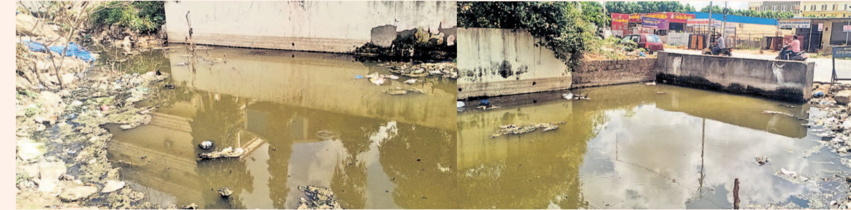
బదంగపేట ప్రధాన రహదారి పక్కన మురికి కూపంగా మారిన దృశ్యాలు

అందోకన వ్యక్తం చేస్తున్నారు. రంగారెడ్డి జిల్లా కలెక్టర్ కార్యాలయానికి, విమానాశ్రయానికి నిత్యం వేలాది వాహనాలు ప్రయాణించే రహదారి మురికి