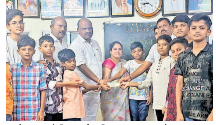
ఆర్కేపురం, అక్టోబర్ 14: ఎల్సీనగర్ విద్యార్థులకు అనాథ విద్యార్థి గృహ విరాళం కమిటీ కల్పించిన అన్ని విద్యార్థులకు రూ.50వేల విరాళం అందజేసింది. ఈ కార్యక్రమంలో గృహ విద్యార్థులు, అనాథ విద్యార్థులు, అధికారులు, ప్రజాప్రతినిధులు, స్థానికులు, కార్యకర్తలు పాల్గొన్నారు.