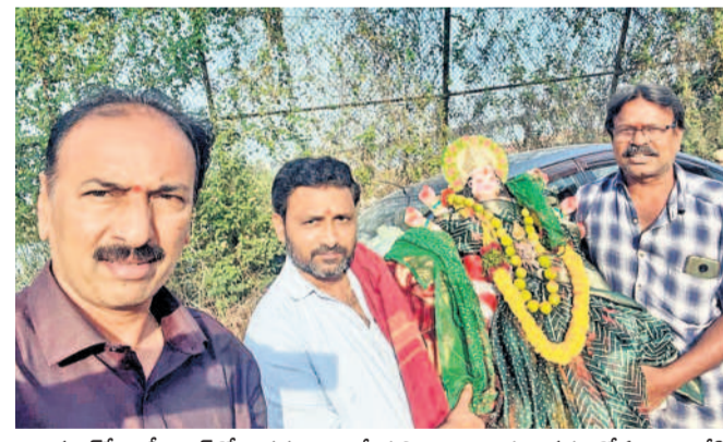
మలక్వేట్ బీ-బ్లాక్లోని ప్రసన్నాంజనేయస్వామి ఆలయ ఆవరణలో ఏర్పాటు చేసిన దుర్గామాత అమ్మవారిని నిమజ్జనానికి తరలిస్తూ ఆలయ కమిటీ ప్రతినిధులు, అధ్యక్షులు