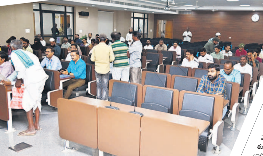
అధికారులు హాజరుకాకపోవడంతో ఖాళీగా దర్శనమిస్తున్న కుర్చీలు

'ప్రైవేట్' దోపిడీ ఆర్టీసీ వైఫల్యాన్ని ప్రైవేట్ వాహనాలు సామ్యు చేసుకున్నాయి. ప్రయాణికుల అవసరాలను ఆసరాగా చేసుకుని దండుకున్నాయి. ఆర్టీసీ బస్సులు లేక, బస్సాండలో పడిగాపులు కాయాల్సిన దుస్థితినిల కొంది. ప్రైవేట్ వాహనాలను ఆశ్రయించారు. ఇదే అదనుగా వారు టిటి బిట్టె రెండింతల చార్జీలు అదనంగా వసూలు చేశారు. తప్పనిసరి వెళ్లాలి రావడంతో అదనపు భారం మోసుక తప్పలేదు. హైదరాబాద్ మాస్టర్ల కిక్కిరిసిన ప్రయాణికులతో ప్రైవేట్ వాహనాలు దూసుకెళ్లాయి.