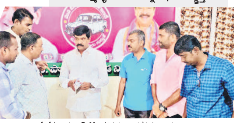
ఎమ్మెల్యే వేములకు ప్రశాంత్ రెడ్డికి వినతిపత్రం అందజేస్తున్న బాధితులు

మెర్సాడ్, అక్టోబర్ 14: కిడ్నీ సమస్యలతో బాధ పడుతున్న తమకు నెలకు రూ.10 వేల పింఛన్ ఇవ్వాలని బాధితులు డిమాండ్ చేశారు. ఈ మేరకు ప్రభుత్వంపై ఒత్తిడి తెచ్చేలా అసెంబ్లీలో తమ గురించి ప్రస్తావించాలని బాధితులు.. మాజీ మంత్రి, బాల్కొండ ఎమ్మెల్యే వేముల ప్రశాంత్ రెడ్డికి వినతిపత్రం సమర్పించారు. ఆర్కాట్, బాల్కొండ, నిజామాబాద్ రూరల్ నియోజకవర్గాలకు చెందిన బాధితులు వేల్పూర్లో సోమవారం ఎమ్మెల్యే వేములకు కలిశారు. రాష్ట్ర వ్యాప్తంగా ఉన్న కిడ్నీ బాధితులంతా కలిసి ప్రజాభివృద్ధి వ్యాజ్య వినతిపత్రం సమర్పించామని, అయినా ఎలాంటి సృందనలేదని వేముల