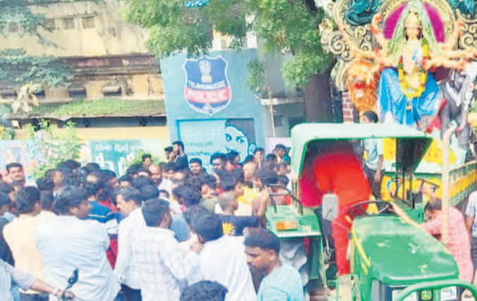
ఆర్కాట్ ఏసీపీ కార్యాలయం ఎదుట దుర్గామాత విగ్రహంతో నిరసన తెలుపుతున్న మాలదారులు, యువకులు