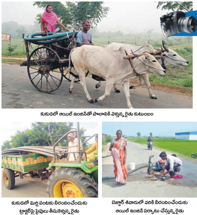
కుకుడలో మిర్చి పంటకు నీరందించేందుకు ట్రాక్టర్ పై పైపులు తీసుకెళ్తున్న రైతు