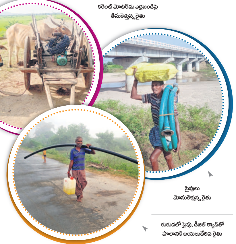
కుకుడలో పైపు, డీజిల్ క్యాంక్ పాలానికి బయటదేరిన రైతు