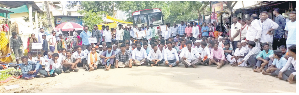
కౌటాల మార్కెట్ ఏరియాలో ప్రధాన రహదారిపై ధర్నా చేస్తున్న రైతులు