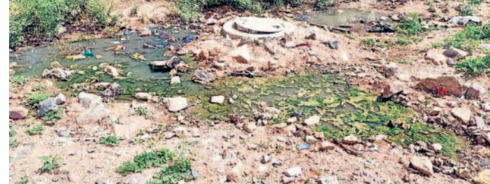
ఎల్ఐజీ కాలనీలో ఇండ్లమధ్య నిలిచిన మురుగునీరు;