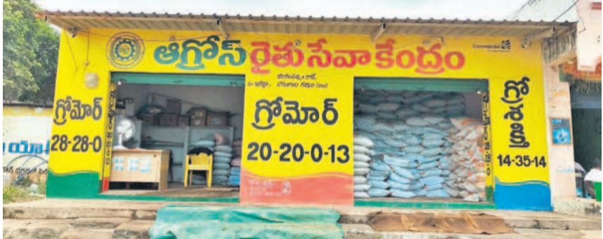
జిల్లాకాల మండలం జింకలపల్లె స్టేజీ వద్ద ఉన్న ఆగ్రోసేవ కేంద్రం