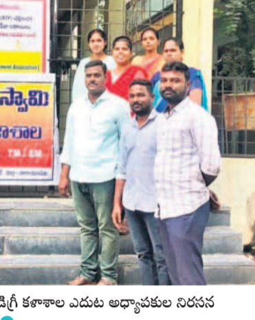
గద్వాల జిల్లా కేంద్రంలో నిరసన తెలుపుతున్న ఎస్.వీ.ఎం డిగ్రీ కళాశాల అధ్యాపకులు