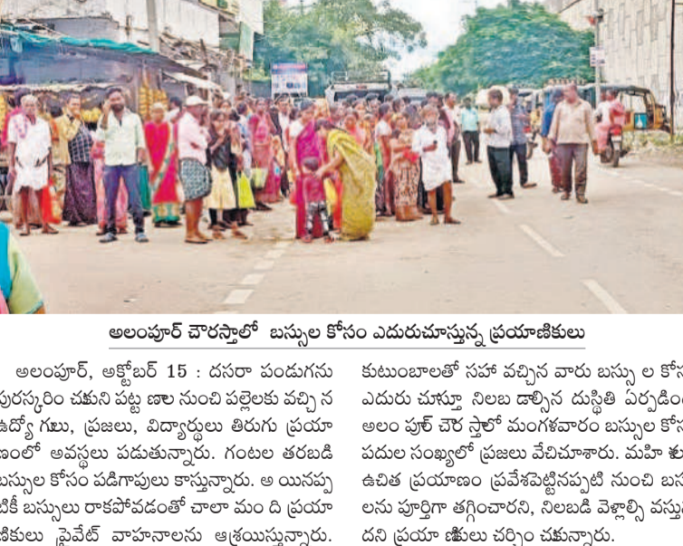
అలంపూర్ చౌరస్ లో బస్సుల కోసం ఎదురుచూస్తున్న ప్రయాణికులు

అలంపూర్, అక్టోబర్ 15 : దనరా పండుగను ఉద్ఘాటించే చతుస్ర పట్టణం నుంచి పల్లెలకు వచ్చిన అలంపూర్, ప్రజలు, ప్రజలు, విద్యార్థులు తిరుగు ప్రయాణంలో అవస్థలు పడుతున్నారు. గంటల తరబడి బస్సుల కోసం పడిగాపులు కాస్తున్నారు. అయినప్పటికీ బస్సులు రాకపోవడంతో చాలా మంది ప్రయాణికులు ప్రైవేట్ వాహనాలను ఆశ్రయిస్తున్నారు.