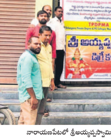
నారాయణపేటలో శ్రీఅయ్యప్ప స్వామి డిగ్రీ కళాశాల ఎదుట అధ్యాపకుల నిరసన