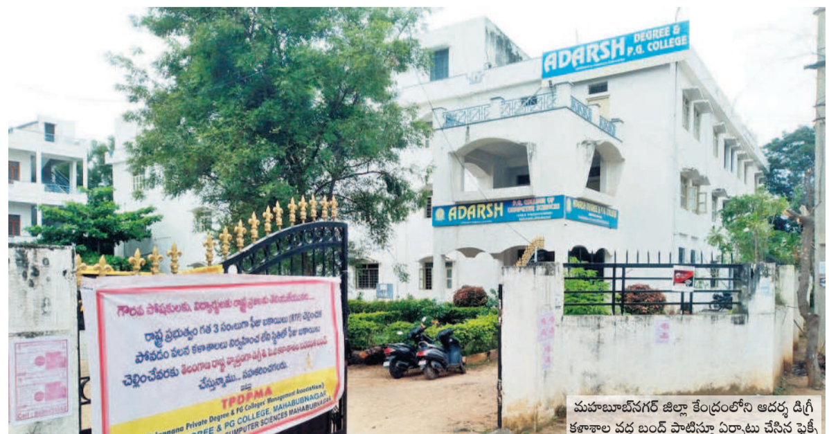
మహబూబ్ నగర్ జిల్లా కేంద్రంలోని అదర్స్ డిగ్రీ కళాశాల వద్ద బండ్ల పాటిస్తూ ఏర్పాటు చేసిన స్టేజీ

మహబూబ్ నగర్ విద్యాభివృద్ధి, అక్టోబర్ 15 : ఆర్థిక కారణాలతో పేద, మధ్య తరగతి విద్యార్థులు ఉన్నత చదువులకు దూరం కావడంపై అక్టోబర్ ప్రవేశ పరీక్షలకు 'బో' డా రుసుములు చెల్లింపు పథకంపై ప్రభుత్వం నిర్ణయం వ్యవహరిస్తున్నది. ఈ పథకం కోసం ప్రైవేట్ కళాశాలల్లో చదివే విద్యార్థులకు కోర్సుల ఫీజులను ప్రభుత్వమే చెల్లించాలి ఉంటుంది. ఇది రెండు రకాలు. మొదటి ఎంటిఎఫ్-మెంట్ అఫ్ ట్యూషన్ ఫీ (విద్యార్థుల మెంట్ శాస్త్రం కోసం విద్యార్థుల వ్యక్తిగత ఖాతాల్లో జమ చేస్తుంది). రెండోది ఆంటిఎఫ్-రియంబర్స్ మెంట్ అఫ్ ట్యూషన్ ఫీ (కళాశాల యాజమాన్యాల ఖాతాల్లో జమ అవుతుంది). కానీ, కాంగ్రెస్ ప్రభుత్వం ఈ రెండు విధానాల ఫీజు చెల్లింపుతో తాత్కాలం చేయడంతో పేద విద్యార్థుల భవిష్యత్ అగమ్య గోచరంగా మారుతున్నది.