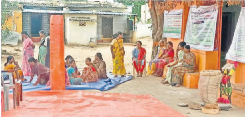
కొనుగోలు కేంద్రాన్ని ప్రారంభించిన కార్యక్రమంలో నిరాశతో కూర్చున్న మహిళలు