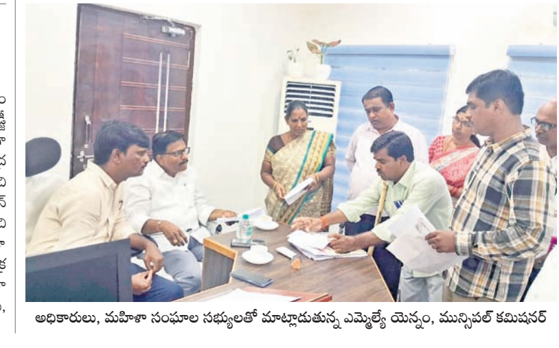
అధికారులు, మహిళా సంఘాల సభ్యులతో మాట్లాడుతున్న ఎమ్మెల్యే యెన్నం, మున్సిపల్ కమిషనర్