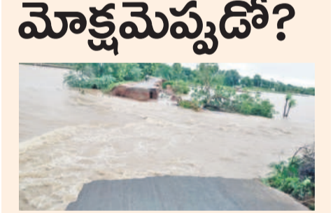
ఆగస్టులో వీణవంక-కనపల్లి గ్రామాల మధ్య వర్షానికి కొట్టుపోయిన రోడ్డు

వీణవంక, అక్టోబర్ 16 : ఏండ్లనాటి బ్రిడ్జ్ నిర్మాణం కల నెరవేరుతుందని.. తమ వెతలు తీరడానికే ఆసక్తి ఉన్న గ్రామాల ప్రజలకు నిరాశ మిగులుతున్నది. బీఆర్‌ఎస్ ప్రభుత్వంలో నిధులు మంజూరైనా పనులు పూర్తిమై నిర్లక్ష్యం కొనసాగుతున్నది. వీణవంక మండలంలోని కనపల్లి గ్రామం మండల కేంద్రానికి సుమారు 5 కిలోమీటర్ల దూరంలో ఉంది. వర్షాలు పడినప్పుడు ఈ గ్రామం నుంచి వీణవంకకు వెళ్లే రోడ్డు పరిస్థితి దారుణంగా మారుతున్నది. గ్రామం నుంచి పైనే ఉన్న తీరిగి ఊరవెరువు నుంచి బంధంకుంటున్న ప్రపంచీపేట వరకు తాకిడికి తెగిపోతున్నది. ఈ రోడ్డుపై రాకపోకలు నిలిచి, కనపల్లిలోపాటు శంకర పట్నం మండలం కల్యణ, గడ్వాల, వీణవంక మండలం జేఐఆర్, వీణవంక గ్రామస్థులు ఇబ్బంది పడాల్సి వస్తున్నది. ఇలాంటి సమయంలో కేంద్రానికి వెళ్లాలంటే కిలోమీటర్ల కొద్దీ ప్రయాణించాల్సి వస్తున్నది. ఈ సమస్యను గతంలో బీఆర్‌ఎస్ ప్రభుత్వం దృష్టికి తీసుకెళ్లగా, 2023లో బ్రిడ్జ్ నిర్మాణానికి ₹1.25 కోట్ల, రెండు కిలోమీటర్ల రోడ్డు నిర్మాణానికి ₹2.40 కోట్ల నిధులు మంజూరు చేసింది. అయితే, తర్వాత ప్రభుత్వం మారడంతో ఎక్కడ వేసిన గొంతోనే మరచిపోతూ నిర్లక్ష్యం చూపింది.