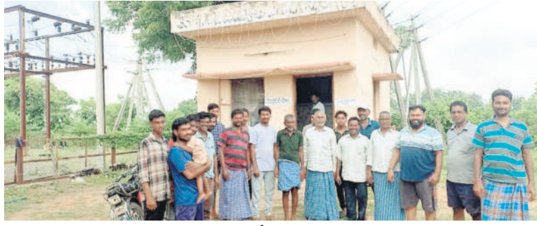
కల్వర్షర్ గ్రామ సబ్‌స్టేషన్ ఎదుట గ్రామస్థులు

రామగిరి, అక్టోబర్ 16 : మాటిమాటికీ కరోన్ కోతలు విధించడంపై పెద్దపల్లి జిల్లా రామగిరి మండలం కల్వర్షర్ గ్రామస్థులు మండిపడ్డారు. కోతలను నివారించాలని డిమాండ్ చేస్తూ బుడ వారం గ్రామంలోని విద్యుత్ సబ్‌స్టేషన్ ముట్టడించారు. నాలుగు నెలల నుంచి తరచుగా విద్యుత్ సరఫరాకు అంతరాయం ఏర్పడుతున్నదని, తాము చీకట్లో ఉండాల్సి వస్తున్నదని వాపోయారు. విద్యుత్ సరఫరా తీగలు తెగిపోతున్నాయని, ఇండ్లపై పడుతున్నాయని అంటోళిన వ్యక్తుల చేశారు. ఈ విషయమే అధికారులకు విస్తృతంగా పట్టించుకోవడంలేదని విమర్శించారు. ఇప్పటికైనా లూజ్‌లైనను సవరించి కొత్తగా వైర్ల బిగించాలని డిమాండ్ చేశారు.