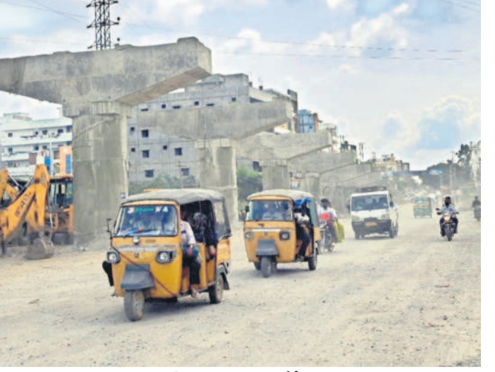
పిల్లల్లో పరిమితమైన ఆర్‌వోబీ పనులు

పనుల్లో నిర్లక్ష్యం తీగలగుట్ట ప్రభుత్వం రైల్వే ఓవర్ బ్రిడ్జ్ నిర్మాణం కోసం రైల్వే శాఖకు పనులొస్తున్న లిఖిత పూర్వకంగా విస్తృతమైంది. ఆ సంస్థకు కాస్తా సుందరి అవ్వడం నిర్మాణానికి గ్రీన్ సిగ్నల్ ఇచ్చింది. దీని నిర్మాణంలో రాష్ట్ర ప్రభుత్వం కూడా భాగస్వామి కావాలని నూచించడంతో అప్పటికప్పుడు తన పంతులూ కూడా విడుదల చేసింది. 154 కోట్ల వ్యయంతో నాలుగు వరుసల్లో 750 మీటర్ల పొడవు, 21 మీటర్ల వెడల్పుతో పంతుల పనులు రహదారులు, భవనాలు శాఖ ఆధ్వర్యంలో చేపట్టారు. 2023 జూలై 13న అప్పటి రాష్ట్ర మంత్రి గంగుల కమలాకర్, ప్రణాళికా సంఘం ఉపాధ్యక్షుడు బి.వి.కేశవ్ మార్ కలిసి పనులకు శంకుస్థాపన చేశారు. ఆరునెలల పాటు శరవేగంగా కొనసాగా, అంతలోనే అసెంబ్లీ ఎన్నికలు రావడం, నిధుల విడుదలలో జాప్యం జరగడంతో పనులు నిలిచాయి. అయితే, ప్రస్తుత