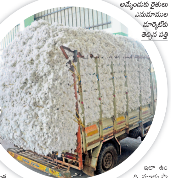
అమ్మోందుకు రైతులు ఎనుమాముల మార్కెట్ కు తెచ్చిన పత్తి

ఈనాటి పత్తి రైతు పరిస్థితి దయనీయంగా మారింది. ఓ వైపు ప్రతికూల పరిస్థితులతో పూత, కాతపై ప్రమాదం చూపి అశించిన దిగుబడి రాకపాపే మార్కెట్లో పత్తి రైతుల అరకొర పంటకు 'మద్దతు' కరువుంది. భారీ వర్షాలతో ఇప్పటికే నష్టపోయి కుంగిపోతున్న రైతులను పెట్టుబడి భారం పెరగడం మరింత కలవరపడుతున్నది. దీనికి తోడు సీసీబి కొనుగోలు కేంద్రాలు ప్రారంభించకపోగా ప్రైవేట్లో మాత్రం కొనుగోళ్లు జోరందుకున్నాయి. అలాగే వ్యాపారుల మాయాజాలంతో అక్కడా రైతులకు నష్టం కలుగుతున్నది. అటు వరంగల్ లోని ఎనుమాముల మార్కెట్లోనూ కొనుగోళ్లు మొదలైనప్పటి నుంచి ఇప్పటివరకు బిక్కు రోజు కూడా ప్రభుత్వ మద్దతు ధర దక్కకపోవడంతో నిరాశ మిగులు తున్నది. గురువారం క్లింటాల్స్ పత్తికి రూ. 7,010 ఉండగా రోజురోజుకూ తగ్గుతూనే ఉంది. దీనికి తోడు మార్కెట్లో కనీస వసతులు లేక రైతులు ఇబ్బందులు పడుతున్నా అధికారుల పర్యవేక్షణ లోపం నష్టంగా కనిపిస్తున్నది. - వరంగల్, మహబూబాబాద్, జయశంకర్ భూపాలవల్లి, జనగామ, అక్టోబర్ 17(నమస్తే తెలంగాణ)/కేసముద్రి