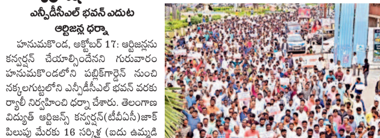
హనుమకొండ వద్ద గార్డెన్ నుంచి ఎన్పీడీసీఎల్ భవన్ వరకు రావల్లి వచ్చిన ఆర్జిజన్