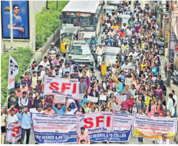
ఎన్ఎఫ్ఎ విద్యార్థి సంఘం ఆధ్వర్యంలో గురువారం నారాయణగూడ చౌరస్తా వద్ద బహుళ విద్యార్థుల ఉన్న ఓజీ రియల్ ఎస్టేట్లో నిరసన ర్యాలీ