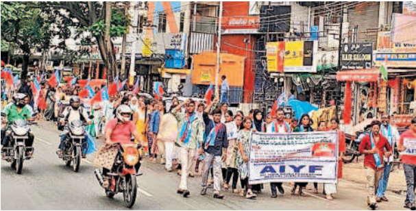
ఏబిఎఫ్ ఆధ్వర్యంలో ఈసీఐఎల్లో విద్యార్థుల నిరసన ర్యాలీ

ఏబిఎఫ్, ఎన్ఎఫ్ఎ ఆధ్వర్యంలో జిల్లా వ్యాప్తంగా పలు చోట్ల విద్యార్థుల నిరసన ర్యాలీలు, ధర్మా