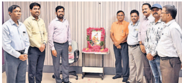
జల మండలి కార్యాలయంలో వాల్మీకి చిత్రపటానికి నివాళులర్పిస్తున్న సభ్యులు