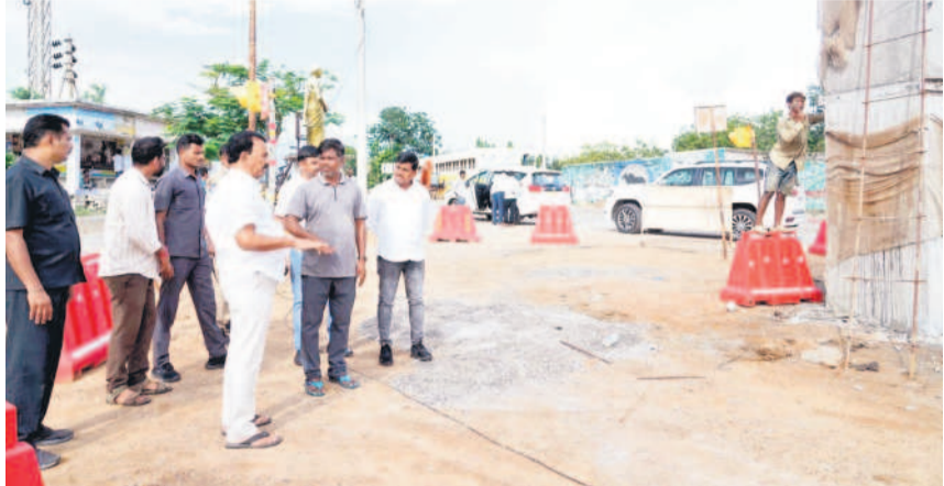
ఫైవర్ పనులను పరిశీలిస్తున్న ఎక్సైజ్, పర్యాటక శాఖల మంత్రి జూపల్లి కృష్ణారావు

• ఎక్సైజ్, పర్యాటక శాఖల మంత్రి జూపల్లి కృష్ణారావు కొల్హాపూర్, అక్టోబర్ 18 : కల్వకుర్తి, నంద్యాల జాతీయ రహదారి 167 కి నిర్మాణ పనులను శుక్రవారం ఎక్సైజ్, పర్యాటక శాఖల మంత్రి జూపల్లి కృష్ణారావు తనిఖీ చేశారు. జాతీయ రహదారి నిర్మాణంలో భాగంగా కొల్హాపూర్ నుంచి చౌబట్ల గ్రామానికి వెళ్లే దారిలో ఫైవర్ నిర్మాణం ఎత్తు చాలా తక్కువగా ఉండని భవిష్యత్లో వా