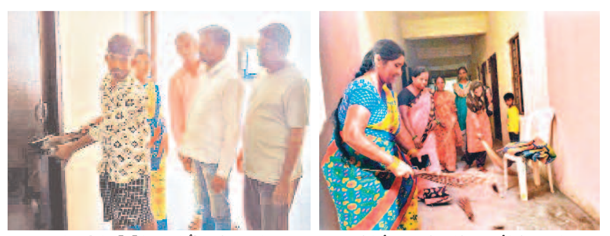
తాళాలు పగులకొట్టి డబుల్ డెడలైండ్ ఇండ్లల్లో వెళ్తున్న లబ్ధిదారులు తమకు కేటాయించిన ఇండ్లను శుభ్రం చేస్తున్న లబ్ధిదారులు

చిన్న సైజు చేప పిల్లలు పంపిణీ చేయడంపై ఆందోళన వ్యక్తం చేస్తున్న మత్స్యకారులు, మంధనిలో పంపిణీకి వచ్చిన చిన్న సైజు చేప పిల్లలు