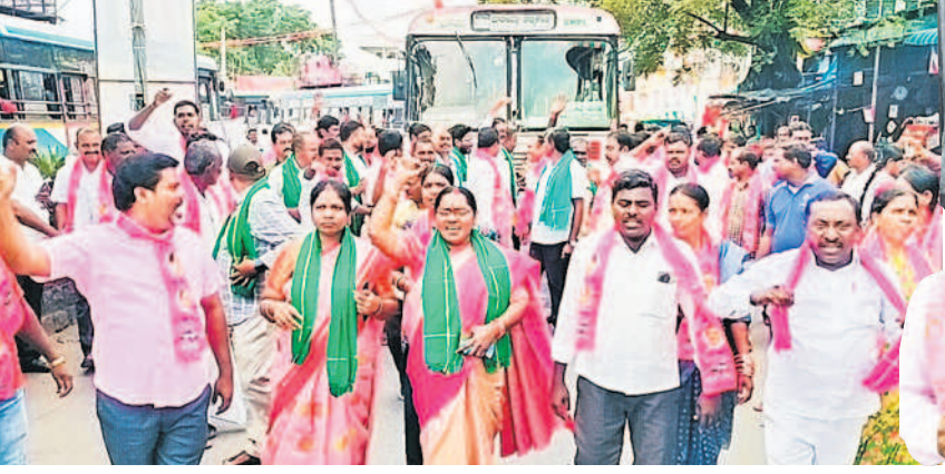
వరకాలలో కాంగ్రెస్ ప్రభుత్వం వైఖరిపై నిరసన వ్యక్తం చేస్తున్న బీఆర్ఎస్ నాయకులు