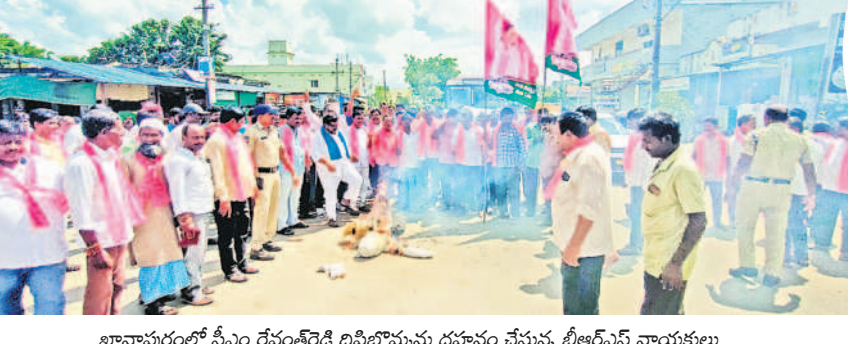
భూనాభరంలో సీఎం రేచంట్ రెడ్డి దిష్టిబొమ్మను దహనం చేస్తున్న బీఆర్ఎస్ నాయకులు