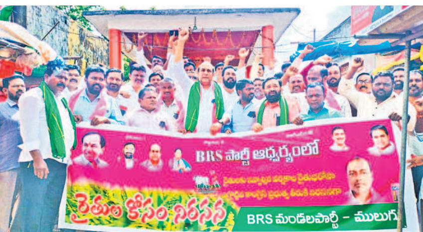
ములుగులోని గాంధీవోల్ వద్ద నల్లబ్యాడ్జీలు ధరించి రైతులకు మద్దతుగా నివాదాలు చేస్తున్న బీఆర్ఎస్ నాయకులు