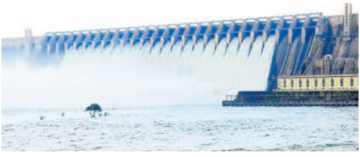
20 క్రోస్ గేట్ల ద్వారా కొనసాగుతున్న సాగర్ నీటి విడుదల

నందికొండ, అక్టోబర్ 19 : నాగార్జునసాగర్ కు ఇన్ఫో మెటర్లతో అదివారం ద్వారా 20 క్రోస్ గేట్ల ద్వారా నీటిని దిగువ విడుదల చేశారు. శ్రీశైలం నుంచి 2,44,132 క్యూసెక్కుల నీరు సాగర్ కు వచ్చి చేరుతుండడంతో, ద్వారా 14 క్రోస్ గేట్లను 5 అడుగులు, 6 క్రోస్ గేట్లను 10 అడుగుల మేర ఎత్తి 2,02,678 క్యూసెక్కుల నీటిని వదిలారు. ఎడమ కాల్వ ద్వారా 6,178 క్యూసెక్కులు, కుడి కాల్వ ద్వారా 3,371 క్యూసెక్కులు, ప్రధాన జలవిద్యుత్ కేంద్రం ద్వారా 29,110 క్యూసెక్కులు, వరద కాల్వ