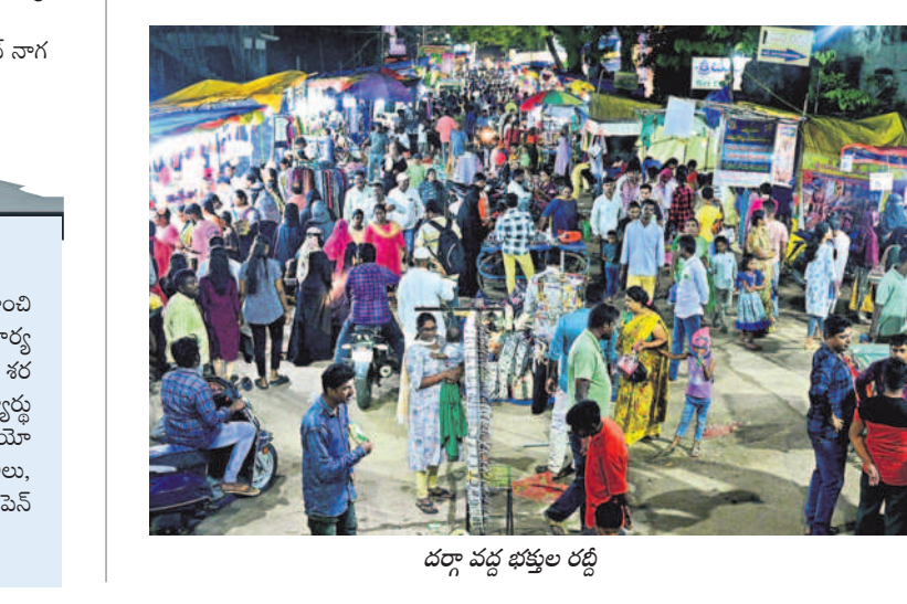
దర్గా వద్ద భక్తుల రద్దీ

నల్లగొండ జిల్లా కేంద్రంలోని హజ్రత్ సయ్యద్ షా లతీఫ్ ఉల్లా ఖాద్రి ఉర్సు ఘనంగా కొనసాగుతున్నది. ఆదివారం నాలుగో రోజు ఉత్సవ కమిటీ పలు కార్యక్రమాలు చేపట్టింది. వివిధ ప్రాంతాల నుంచి భక్తులు పెద్ద సంఖ్యలో తరలివచ్చి మొక్కులు తీర్చుకున్నారు. ఉర్సు సందర్భంగా ఏర్పాటు చేసిన దుకాణాల వద్ద జనం కొనుగోలుతో ఆ ప్రాంతమంతా సందడిగా మారింది.