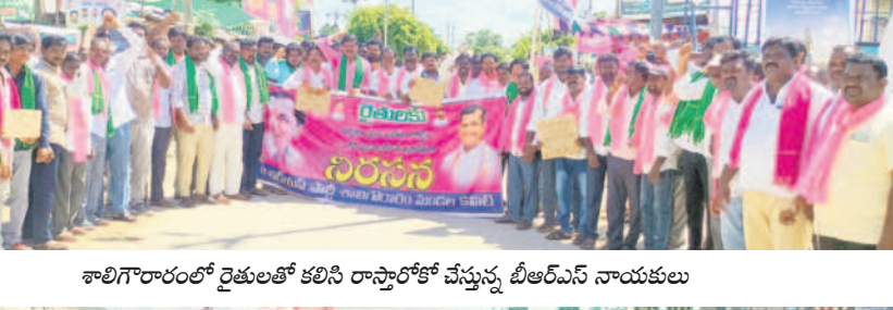
తిరుమలగిరి : రైతు భరోసా ఎగవేత పై నిరసన రైల్వే నిర్వహిస్తున్న బీఆర్ఎస్ శ్రేణులు