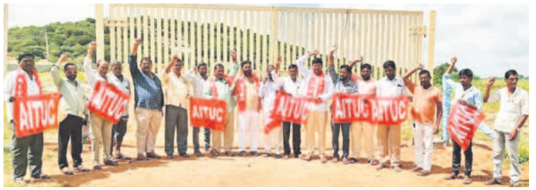
రామన్నపేటలో అదానీ కంపెనీ నిర్మించబోతున్న స్థలం వద్ద దర్శా చేస్తున్న ఏబిఎస్ నాయకులు