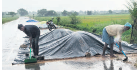
కుంటూరు అందకూర్ ధాన్యం కుప్పలపై కవచ కప్పితున్న రైతులు

ఖైసా, అక్టోబర్ 21 : పట్టణంలో సోమవారం మధ్యాహ్నం ఉరుములు, మెరుపులతో కూడిన వర్షం కురిసింది. గాంధీ గంజీకు తీసుకవచ్చిన సోయా తడిని బస్సులు. పట్టణ రోడ్డుపై డ్రైనేజీలను కొనసాగించే ప్రయత్నం చేస్తున్నారని తెలుస్తోంది. నేల తడిపడడంతో యంత్రాలతో సోయా పంటను కోస్తున్న రైతులకు తీవ్రమైన కష్టం లేదు.