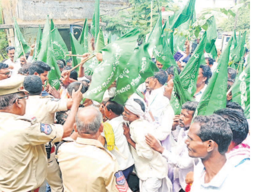
కలెక్టర్ కార్యాలయంలోకి వస్తున్న తుడుండెట్ల నాయకులు, రైతులను అడ్డుకుంటున్న పోలీసులు