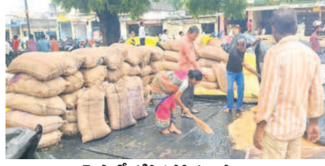
ఖైసాలో తడిని సోయా బస్సులు