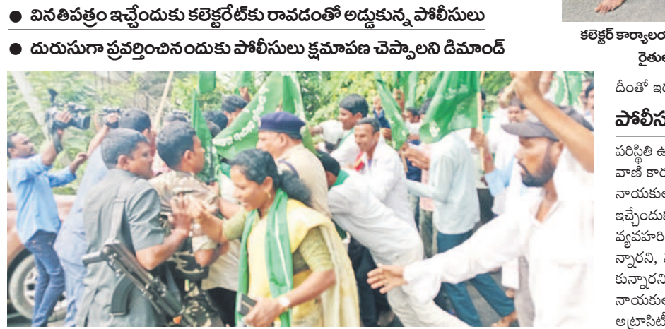
కలెక్టర్ కార్యాలయంలోకి వస్తున్న తుడుండెట్ల నాయకులు, రైతులను అడ్డుకుంటున్న పోలీసులు

దీంతో ఇరు వర్గాల మధ్య తోపులాట జరిగింది. పోలీసులపై చర్యలు తీసుకోవాలి