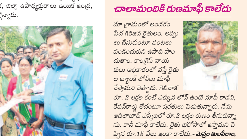
కలెక్టర్ కు వినతిపత్రం అందజేస్తున్న తుడుండెట్ల నాయకులు

దీంతో ఇరు వర్గాల మధ్య తోపులాట జరిగింది. పోలీసులపై చర్యలు తీసుకోవాలి