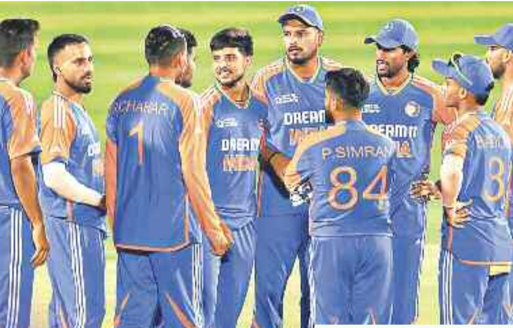
భారత్ 'ఎ' జట్టులో చోటు