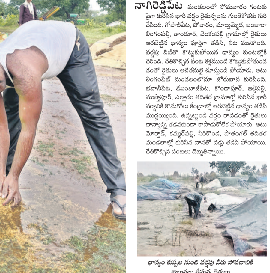
ధాన్యం కుప్పల నుంచి వర్షపు నీరు పోవడానికి కాలువలు తీస్తున్న రైతులు

అకాల వర్షాలతో రైతులు విలవిల్లుతున్నారన్నారు. కష్టమందే వడ్ల వరదలో కొట్టుకుపోతుండడం మానే కన్నీళ్లు పెట్టుకున్నారు. సకాలంలో ధాన్యం కొనుగోళ్లు చేయని ప్రభుత్వాన్ని తిట్టుకుంటూ, కొట్టుకుపోయిన వడ్లను దోస్తోతో విరుతున్నారు. సోమవారం ఉమ్మడి జిల్లాలోని పలు ప్రాంతాల్లో కనిపించిన దృశ్యాల్ని.. నాగిరెడ్డిపేట, లింగంపేట, మోర్రాడ్, కమ్మర్పల్లి, సిరికొండ, పాతంగల్ తదితర మండలాల్లో సోమవారం కురిసిన బాలి వర్షం రైతులను నిండా ముంచింది. కల్లాల్లో ఆరబెట్టిన ధాన్యం తడిసి ముద్దగా, కోతకు సిద్ధంగా ఉన్న వరి పైద్ర నలవాలాయి. ఒక్కసారిగా వచ్చిన వానతో ధాన్యాన్ని కాపాడుకోలేక రైతాంగం చేష్టలాడిగి మాడూరిన పరిస్థితి నెలకొన్నది. మాస్ట్రుండగానే వర్షం దంబికొట్టడం, వరద ఏడల్లై ధాన్యం కుప్పలను ముంచెత్తడం, ఆ ఉద్ధతికే వడ్ల కొట్టుకుపోతుంటే వాటిని అపలేక, పంటను కాపాడుకోలేక రైతులు తీవ్ర మనోవేదనకు గురయ్యారు. ఉష్ణోగ్రతను కన్నీళ్లు దిగమంగుంటూ జోరు వానలోనూ వడ్లను కాపాడుకునేందుకు అప్రకృష్టాలు పడ్డారు. -నాగిరెడ్డిపేట/లింగంపేట/మోర్రాడ్/పాతంగల్, అక్టోబర్ 21