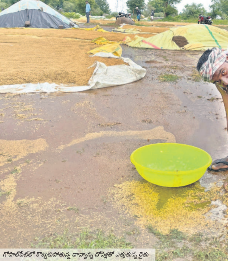
గోపాల్పేటలో కొట్టుకుపోతున్న ధాన్యాన్ని దోస్తోతో ఎత్తుతున్న రైతు

కొనుగోళ్లు లేక విలవిల.. సుమారు నెల క్రితమే వరి కోతలు ప్రారంభం కాగా, 15 రోజుల నుంచి ఉపండుకున్నాయి. బోధన్, బాన్సువాడ డివిజన్లో సగానికి పైగా కోతలు పూర్తి కావచ్చాయి. లింగంపేట, నాగిరెడ్డిపేట తదితర మండలాల్లో ఎక్కడ చూసినా ధాన్యపు రాసులే కనిపిస్తున్నాయి. అయితే, కొనుగోళ్లు ప్రారంభం కాకపోవడంతో రైతులు దిగాలు చెందుతున్నారు. వడ్ల కొనుగోళ్లకు సంబంధించి కాంగ్రెస్ ప్రభుత్వం ముందస్తు ఏర్పాట్లతో పూర్తిగా విఫలం కావడం, అదే సమయంలో అకాల వర్షాలు వెంటాడుతుండడంతో రైతుల కష్టాలు రెట్టించిపోయాయి. కొనుగోళ్లు కేంద్రాలను జోరుగా ప్రారంభిస్తున్నా కొతలు కాంటాలు మేసింది లేదు. ఒక్క గింజా కొన్నట్లే దేవులు. ఇదేమిటని రైతులు ప్రశ్నిస్తే అధికారుల నుంచి సమాధానం కరువైంది. అయితే, మిల్లల్లో ధాన్యం తీసుకోవడానికి ముందుకు రావడం లేదని తెలిసింది. కాంటాలు వేయక పోవడంతో ఎక్కడికక్కడ వడ్ల కుప్పలు వేరుకుపోయాయి. ప్రస్తుతం కరువును వర్షాలతో ధాన్యం కుప్పలు నీట మునిగిపోయాయి. వడ్ల తడిసి రంగం మారుతున్నాయని రైతులు అవేదన వ్యక్తం చేశారు. సకాలంలో కొనుగోళ్లు కేంద్రాల ప్రారంభించి కాంటాలు వేస్తే తమకే కష్టాలు ఉండక పోయేవచ్చన్నారు. కేసీఆర్ సారు ఉన్నప్పుడు ఎలాంటి ఇబ్బందులు లేకుండా వడ్ల అమ్మకాన్ని గుర్తు చేసుకున్నారు. ప్రభుత్వం వెంటనే వడ్ల కాంటాలు ప్రారంభించాలని, రంగం మారిన ధాన్యాన్ని సైతం కొనుగోళ్లు చేయాలని డిమాండ్ చేశారు.