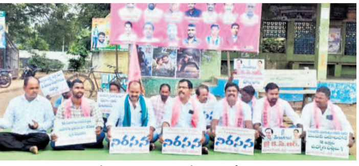
నరసరాజుపేటలో నిరసన కార్యక్రమంలో పాల్గొన్న బీఆర్ఎస్ నాయకులు