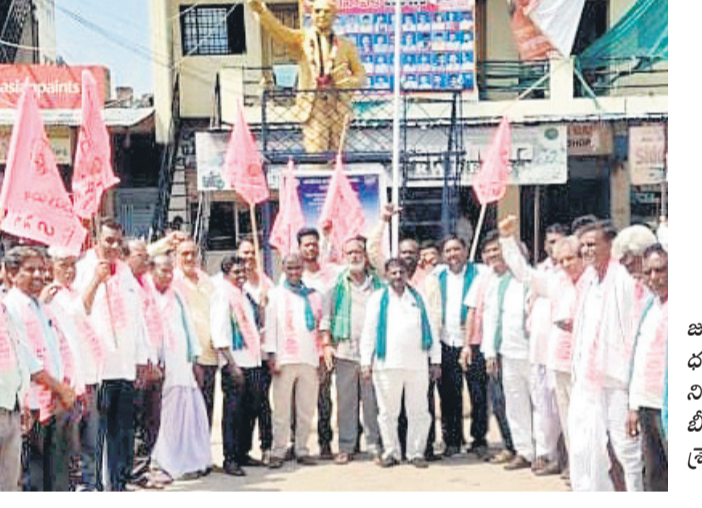
జుక్కల్లో ధర్నా నిర్వహిస్తున్న బీఆర్ఎస్ శ్రేణులు