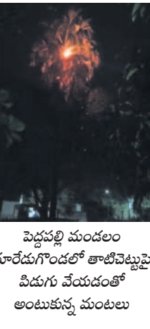
పెద్దపల్లి మండలం మారేడుగొండలో తాటిచెట్టుపై దీడుగు వెయ్యడంతో అంటుకున్న మంటలు

పెద్దపల్లి/ పెద్దపల్లి రూరల్/సారంగాపూర్ అక్టోబర్ 21 : ఉమ్మడి కరీంనగర్ జిల్లాలో సోమవారం సాయంత్రం పలుచోట్ల వర్షం పడింది. దీంతో వరి పంటలకు తీవ్ర నష్టం వాటిల్లింది. జగిత్యాల జిల్లా బీరపూర్ మండలంలోని పలు గ్రామాల్లో ఈదురుగాలులతో వర్షం పడడంతో కోతకొచ్చిన వరిపంటలు నేలకొరిగాయి. తాళ్లధర్మారం గ్రామంలో సుమారు వంద ఎకరాలలో వరి పంటలు నేలవారాయి. ప్రభుత్వం తమను ఆదుకోవాలని రైతులు వేడుకుంటున్నారు. పెద్దపల్లి జిల్లా కేంద్రంలో దాదాపు గంట పాటు వర్షం పడడంతో లోతట్టు ప్రాంతాలు జల మయమయ్యాయి. రాజీవ్ రహదారికి ఇరువైపులా మురికి కాలువ సక్రమంగా లేకపోవడంతో రంగపల్లి స్కూల్ కోట్ల బస్స్టాప్ సమీపంలో రాజీవ్ రహదారి పక్కన ఇంట్లోకి వరద చేరింది. పెద్దపల్లి మండలం మారేడుగొండ లో ప్రధాన రహదారి పక్కన ఉన్న తాటిచెట్టుపై దీడుగు పడడంతో మంటలు అంటుకున్నాయి.