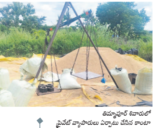
తిమ్మాపూర్ శివారులో ప్రైవేట్ వ్యాపారులు ఏర్పాటు చేసిన కాంటా

రాష్ట్ర ప్రభుత్వం ఆది నుంచీ తమకు వ్యతిరేకంగా ఉండని రైతులు వాపోతున్నారు. కాంగ్రెస్ చెప్పినట్లు రైతులందరికీ రణమాపీ కాకపోవడం, వానకాలం సీజన్ దాటిపోయినా రైతు భరోసా ఇవ్వకపోవడం సర్కారు వైఫల్యమేనని విమర్శిస్తున్నారు. ఈ నేపథ్యంలో దాన్యం కొన్న తర్వాత డబ్బులు