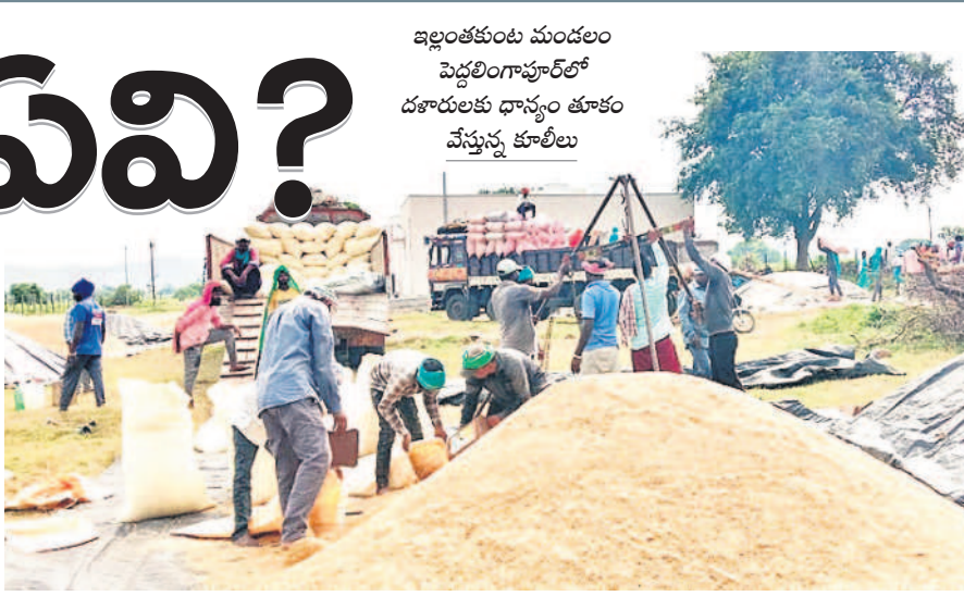
ఇల్లంతకుంట మండలం పెద్దలింగాపూర్లో దశాలులకు దాన్యం తూకం చేస్తున్న కూలీలు

'గ్రామానికి కొనుగోళ్లు కేంద్రం ఏర్పాటు చేస్తే, రైతులకు ఇబ్బంది లేకుండా కొనుగోళ్లు చేస్తే' అని ప్రభుత్వం గొప్పలు చెప్పినా.. ఆవణిలో మాత్రం పరిస్థితి అందుకు విరుద్ధంగా ఉన్నది. ఉమ్మడి జిల్లాలో 1,330 కేంద్రాలు తెరవాల్సి లక్ష్యంగా పెట్టుకొని, ఎమ్మెల్యేలు, మంత్రులు అక్కడక్కడా ఈ కేంద్రాలను ప్రారంభించినా.. ఇంకా ఎక్కడా కొనుగోళ్లు మొదలు కానేలేదు. ఈ పరిస్థితుల్లో రైతులు దాన్యం అమ్ముకునేందుకు దశాలు, వ్యాపారులను ఆశ్రయిస్తున్నారు. ఓ వైపు వర్షం పడుతుండడం, మరోవైపు కేంద్రాల్లో కొనుగోళ్లపాకతో అగ్రఫలసగ్గువకే అమ్ముకుంటున్నారని. అయితే అలా వర్షం కారణంగా తేమ శాతం అధికంగా ఉండని, కేంద్రాల్లో కొనుగోళ్లు జరపాలంటే మరో వార్షికంగా పడుతుండే అధికారులు చెబుతుండగా, ఆ మాత్రం దానికి ఇప్పటికే కొన్నింటిని కేంద్రాలను ప్రారంభించడంకని ప్రశ్నిస్తున్నారు.