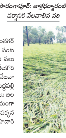
సారంగాపూర్: తాళ్లధర్మారంలో వర్షానికి నేలవారివ వరి