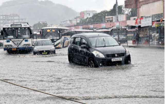
హనుమకొండ బస్స్టాండ్లో నిలిచిన వర్షపునీరు

వరంగల్/నర్సంపేట రూరల్/వాణిజీ, అక్టోబర్ 21: వరంగల్ నగరంలో సోమవారం జోరు వాన కురిసింది. జన జీవనాన్ని అతలాకుతలం చేసింది. నగర రోడ్ల వరద నీటితో నిండిపోయాయి. ప్రధాన రహదారులు జలయమయమయ్యాయి. మోకాళ్ల లోతులో నీరు ప్రవహించింది. వరంగల్ చౌరస్తా, అందర్ ప్రిడ్డి ప్రాంతాలతో పాటు హనుమకొండ బస్ స్టేషన్, బాల సముద్రం, కాకాజీ కాలనీ వరద నీటిలో మునిగిపోయాయి. పాఠశాలలు, కళాశాలలు వదిలిన సమయంలో ఒక్కసారిగా జోరు వాన వడదండో విద్యార్థులు ఇబ్బందులు పడ్డారు. బ్యాగ్లను తెరచి ముందులో పరుగులు పెట్టారు. స్కూళ్ల నుంచి పిల్లలను తీసుకువెళ్లేందుకు వచ్చిన తల్లిదండ్రులు అనుకోకుండా వచ్చిన వానతో ఇబ్బందులు పడ్డారు. నర్సంపేట మండలం మాదన్నపేట, నర్సంపేట, ఇలుకాలపల్లి, గురిజాల, మున్నంపురం, లక్ష్మిపల్లి గ్రామాల్లో వరదంబల నీలవారింది. ములుగు జిల్లా ముందులో అడవి గాలిదుమారంతో భారీ వర్షం కురిసింది.