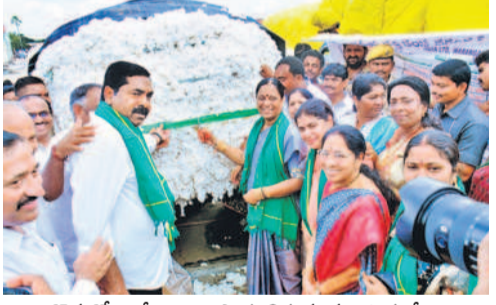
కొనుగోలు కేంద్రాన్ని ప్రారంభిస్తున్న మంత్రి సురేష్, వరంగల్ కలెక్టర్ సత్యశారద, ఎమ్మెల్యే నాగరాజు