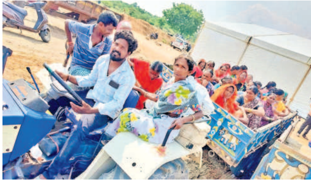
ప్రజాభిప్రాయ సేకరణకు ట్రాక్టర్లలో తరలివెళ్తున్న మహిళలు

ప్రజాభిప్రాయ సేకరణకు వచ్చిన ప్రజలంతా నల్లబ్యాడ్జీలు, నల్లజెండాలతో బహుశా 'అంబుజా సిమెంట్' మా కొద్దు.. అదానీ గోబ్యాక్ అంటూ సేకరణలో రామన్నపేట మట్టా పోలీసులను మోహరించారు. రామన్నపేటకు వచ్చే అన్ని రారుల్లోనూ పోలీసు చెవిపోగులను ఏర్పాటు చేశారు. ప్రతి వాచా