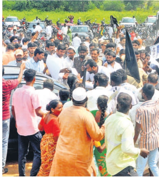
రామన్నపేటలో ప్రజాభిప్రాయ సేకరణకు భారీగా తరలివచ్చిన ప్రజలు, బక్కన ప్రజాభిప్రాయ సేకరణలో అడిషనల్ కలెక్టర్ కారును అడ్డుకుంటున్న స్థానికులు