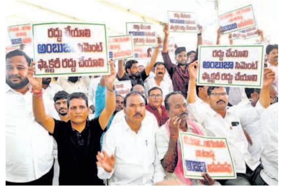
ఫ్యాక్టరీని రద్దు చేయాలని ఘోషించిన ప్రదర్శిస్తున్న నాయకులు