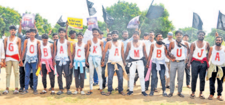
గో బ్యాక్ అంబుజా అంటూ నల్ల బ్యాడ్జీలు, నల్ల జెండాలతో యువకుల విసూత్తు నిరసన