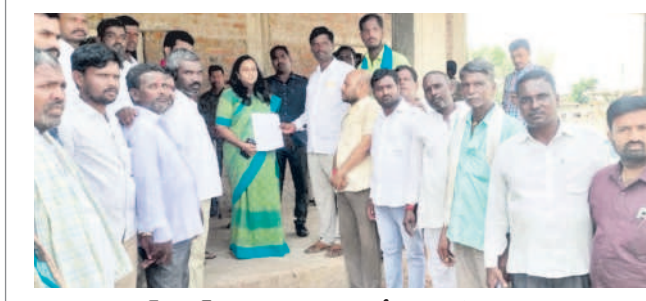
సబ్ కలెక్టర్కు వినతిపత్రం అందజేస్తున్న బుడ్మి గ్రామస్తులు

బాన్పువాడ రూరల్, అక్టోబర్ 23 : బాన్పువాడ మండ లంలోని బుడ్మి ప్రభుత్వ పాఠశాల ప్రధానోపాధ్యాయుడి తీరుపై గ్రామస్తులు సబ్ కలెక్టర్ కిరణ్మయికి బుధవారం ఫిర్యాదు చేశారు. కొందరి మనోభావాలు దెబ్బతినేలా