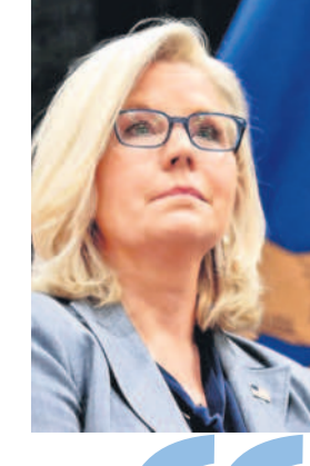
గెరార్డ్ ఫోర్డ్ కోసం నేను మొదటిసారి ఎన్నికల ప్రచారంలో పాల్గొన్నాను. మళ్లీ ఇప్పుడు కమలా హారిస్ కోసం పాల్గొంటున్నాను. ట్రంప్ సాంతగూటిలో ఉన్న రాజకీయ ప్రత్యర్థులపై లపై ప్రశంసల వర్షం కురిపిస్తాడు. లిబరల్స్ పార్టీ నిరంకుశత్వాన్ని ఆలింగనం చేసుకుంటున్నది. డెమోక్రాటిక్ పార్టీకి నేనప్పుడూ ఓటు వేయలేదు కానీ, ఇప్పుడు వేస్తాను. ఎందుకంటే కమలా హారిస్ అమెరికా రాజ్యాంగాన్ని పరిరక్షిస్తారనే నమ్మకం నాకున్నది.

గెరార్డ్ ఫోర్డ్ కోసం నేను మొదటిసారి ఎన్నికల ప్రచారంలో పాల్గొన్నాను. మళ్లీ ఇప్పుడు కమలా హారిస్ కోసం పాల్గొంటున్నాను. ట్రంప్ సాంతగూటిలో ఉన్న రాజకీయ ప్రత్యర్థులపై లపై ప్రశంసల వర్షం కురిపిస్తాడు. లిబరల్స్ పార్టీ నిరంకుశత్వాన్ని ఆలింగనం చేసుకుంటున్నది. డెమోక్రాటిక్ పార్టీకి నేనప్పుడూ ఓటు వేయలేదు కానీ, ఇప్పుడు వేస్తాను. ఎందుకంటే కమలా హారిస్ అమెరికా రాజ్యాంగాన్ని పరిరక్షిస్తారనే నమ్మకం నాకున్నది. - లిజ్ చెనినీ, లిబరల్స్ కోసం మాజీ నేత