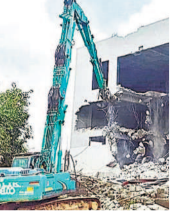
వైఖరికి నిరర్థకం. పేద ప్రజలను ఇప్పటికప్పుడు ఇల్లు ఖాళీచేసి వేరే చోటికి వెళ్లడం అంటే వారికి డిడి కిచ్చారు? కాబట్టి ప్రభుత్వం చెరువుల రక్షణ కోసం పేదలను అక్కడినుంచి తరలించవలసి వస్తుందిగా వాటిలో చెరువులు జరపాలి. వారికి తగిన సమయం ఇవ్వాలి. నిర్మాణాలకు తగిన పునరావాసం, సమర్థనకం చెల్లించాలి. అంతే కానీ, ఇష్టానుసారం వ్యవహరిస్తామంటే ఈ ప్రభుత్వం ప్రజా తిరుగుబాటును చవిపడటమే కాదు, ప్రభుత్వ లోక ప్రభుత్వంగా చరిత్రలో నిలిచిపోతుంది.

ముద్రపెట్టిన కదా సామాన్య ప్రజలు రూపాయి రూపాయి కూడచెట్టి మరల ఆ భూములను కొనుగోలు చేసింది? ఇంట్లు నిర్మించుకున్నది? లేడికి లేచింది పరుగు అన్నట్లుగా సీఎం రేవంట్ డివిజన్ ఇప్పుడు ఆ నిర్మాణాలను కూల్చేయించిన మైదాన అధికారులను ఉసిగొల్పడం ఇబ్బంది? తప్ప ఎవరు చేశారు, ప్రభుత్వం శిక్ష ఎవరికి వేస్తుందో ఒక్కసారి అవలోకనం చేసుకోవాలి. సాంఘిక కలం సాకారం చేసుకునేందుకు గాను తమ జీవితకాలం కష్టం చేసిన సంపాదించుకున్న సామాన్య పోనీ, అప్పులు చేసి ఇల్లు కొన్నవారిదా తప్ప? అనుమతులు ఇచ్చిన అధికారులను మైదాన అధికారులు అయినవారికి అక్కడో తగిన సమయం ఇవ్వాలి. నిర్మాణాలకు తగిన పునరావాసం, సమర్థనకం చెల్లించాలి. అంతే కానీ, ఇష్టానుసారం వ్యవహరిస్తామంటే ఈ ప్రభుత్వం ప్రజా తిరుగుబాటును చవిపడటమే కాదు, ప్రభుత్వ లోక ప్రభుత్వంగా చరిత్రలో నిలిచిపోతుంది.