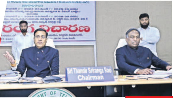
బహిరంగ విచారణలో ఈ ఆర్డీ అధికారులు