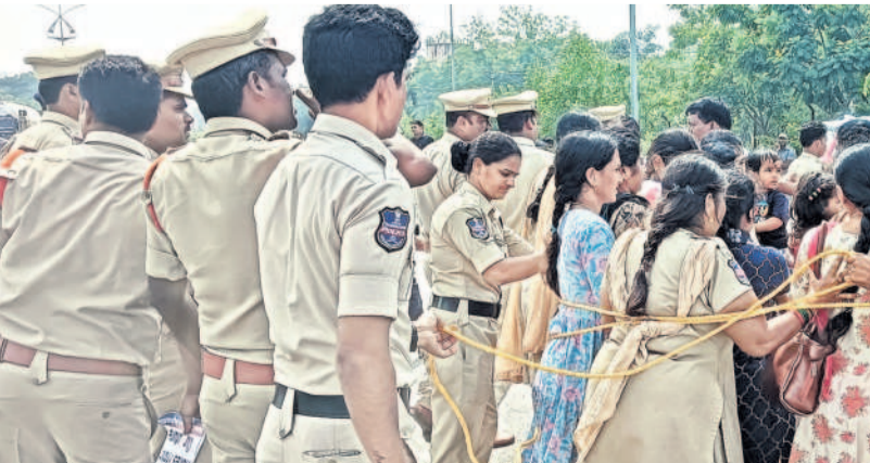
రాష్ట్రాధికారి చేస్తున్న పోలీసుల కుటుంబీకులను బెటాలియన్లకు తరలిస్తున్న డివీపల్లి పోలీసులు