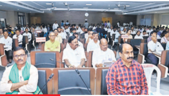
హాజరైన ప్రజాప్రతినిధులు, విరియోగదారులు