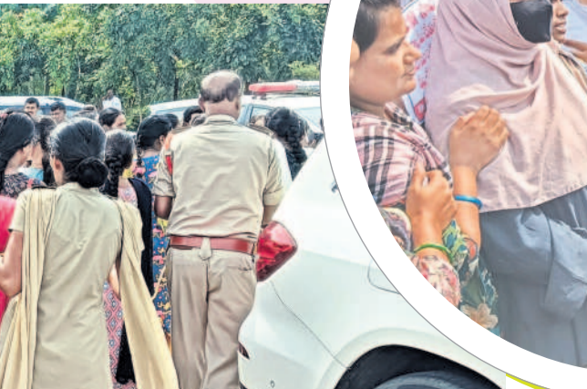
పోలీసు కుటుంబాలతో మాట్లాడుతున్న కేటీఆర్