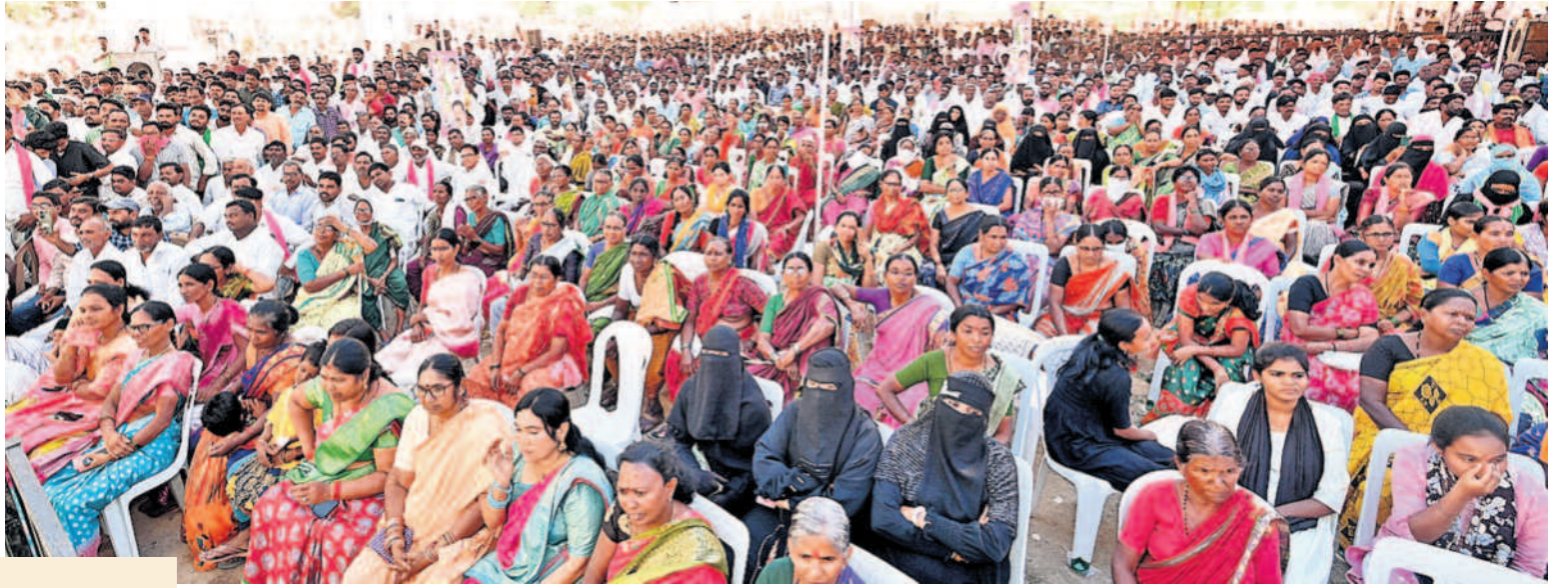
అదిలాబాద్ లో రాంలీలామైదానంలో గురువారం బీఆర్ఎస్ ఆధ్వర్యంలో రైతు నిరసన సభకు వివిధ గ్రామాల నుంచి పెద్దఎత్తున తరలివచ్చిన రైతులు