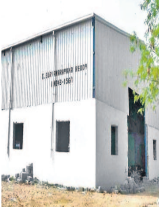
మౌలిక సౌకర్య కల్పన గుర్తించ వివాదాస్పద భూమిలో గోడవేస