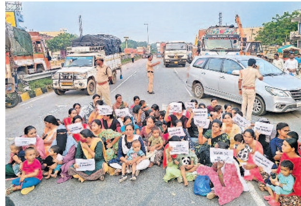
గద్వాల జిల్లా ఎర్రపల్లి మండలంలోని జాతీయ రహదారిపై పిల్లలతో కలిసి ధర్నా చేస్తున్న పదోబెటాయన్ సిబ్బంది భార్యలు

మేడ్చల్, అక్టోబర్ 24 (నమస్తే తెలంగాణ): కోర్టు వివాదంలో ఉన్న దాదాపు 20 ఎకరాల తమ భూమిని కబ్జాదారులతో కలిసి పోలీసులు బలవంతంగా లాగేసుకున్నారంటూ ఓ బాధితుడు ఆరోపించారు. కల్లాల దారులు, వారికి సహకరించిన పోలీసులపై చర్యలు తీసుకోవాలని రాచకొండ పోలీసు కమిషనర్ సుధీర్ బాబును కలిసినా ఫలితం లేకుండా పోయిందని వాపోయారు. కోర్టు ఆర్డర్ ఉంది కాబట్టి తామేమీ చేయలేమని, మాజీ ఎమ్మెల్యే మైనంపల్లి హనుమాంజుల కలవాలని సూచించారని పేర్కొన్నారు. రాచకొండ పోలీస్ కమిషనరేట్ పరిధిలో వెలుగు లోకి వచ్చిన ఈ భూమిలో సంవత్సరం బాధితుడు రాచకొండ వెళ్లి >7వ పేజీలో