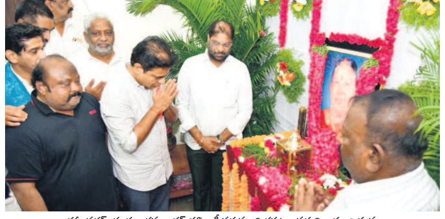
కరీంనగర్: గంగుల కమలాకర్ తల్లి లక్ష్మీనర్దమ్మ బితులబం పద్ద నివాళులర్పిస్తున్న మాజీ మంత్రి, బీఆర్ఎస్ పర్సన్ డైరెక్టర్ కేటీఆర్