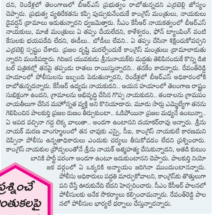
ప్రశ్నించే గొంతుకలపై పగ సాధించు