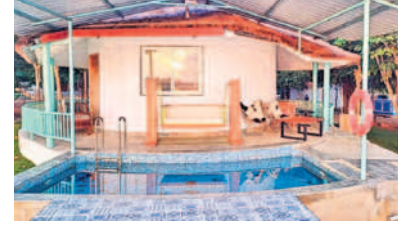
రూముల అటాచ్మెంట్ ఏర్పాటు చేసిన స్విమ్మింగ్ పూల్

పెద్ద స్విమ్మింగ్ పూల్ను నిర్మించారు. కేరళ, లక్ష్మద్వీప్, బాలీలాండ్ల పర్యాటక ప్రాంతాలను పోలిపోయిన ఏర్పాటు పర్యాటకులను ఆకర్షించేలా తెలంగాణ పర్యాటక శాఖ ఆధ్వర్యంలో ఫ్రీకోట్స్ సంస్థ 'దికోవ్' పేరుతో రిసార్టును లీజు పట్టణంలో అందుబాటులోకి తీసుకొచ్చింది. పర్యావరణ హిత టూరిజంగా.. పర్యాటకులను ఆకర్షించేలా 3వ ఐలాండ్లో అధికారులు ఏర్పాటు చేశారు. పర్యావరణ హిత టూరిజంగా అభివృద్ధి చేసే దిశగా 'దికోవ్' రిసార్ట్ మునుపాటిది. స్విమ్మింగ్ పూల్స్, జిప్ లైన్ వంటి అద్వైచర్ గేమ్స్, వాటర్ స్పోర్ట్స్, క్యాంపెయిన్తో పాటు సూతన బోట్తో మినీ బీచ్ ఏర్పాటు చేశారు. పర్యాటకులు సూర్యోదయం, సూర్యాస్తమయాలను వీక్షించేందుకు వీలుగా వ్యూ పాయింట్ను తీర్చిదిద్దారు. పర్యాటకులు సరదాగా చేపలను వేటాడేందుకు సౌకర్యాలను కల్పించారు. అలాగే సైకిలింగ్ బోటింగ్ను కూడా అందుబాటులోకి తీసుకొచ్చారు. పార్లీలు, ప్రీ వెడ్జింగ్ షూట్స్, డెస్టినేషన్ వెడ్జింగ్ లకు అక్షరం రిసార్ట్ సూతన ఆకర్షణగా మారనున్నది.