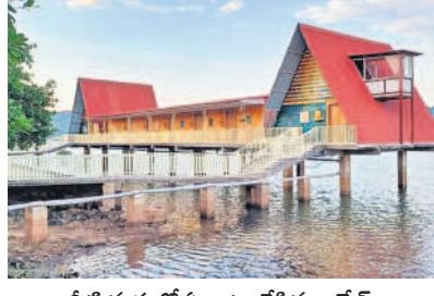
నీటి మధ్యలో ఏర్పాటు చేసిన కాటేజీలు

పెద్ద స్విమ్మింగ్ పూల్ను నిర్మించారు. కేరళ, లక్ష్మద్వీప్, బాలీలాండ్ల పర్యాటక ప్రాంతాలను పోలిపోయిన ఏర్పాటు పర్యాటకులను ఆకర్షించేలా తెలంగాణ పర్యాటక శాఖ ఆధ్వర్యంలో ఫ్రీకోట్స్ సంస్థ 'దికోవ్' పేరుతో రిసార్టును లీజు పట్టణంలో అందుబాటులోకి తీసుకొచ్చింది. పర్యావరణ హిత టూరిజంగా.. పర్యాటకులను ఆకర్షించేలా 3వ ఐలాండ్లో అధికారులు ఏర్పాటు చేశారు. పర్యావరణ హిత టూరిజంగా అభివృద్ధి చేసే దిశగా 'దికోవ్' రిసార్ట్ మునుపాటిది. స్విమ్మింగ్ పూల్స్, జిప్ లైన్ వంటి అద్వైచర్ గేమ్స్, వాటర్ స్పోర్ట్స్, క్యాంపెయిన్తో పాటు సూతన బోట్తో మినీ బీచ్ ఏర్పాటు చేశారు. పర్యాటకులు సూర్యోదయం, సూర్యాస్తమయాలను వీక్షించేందుకు వీలుగా వ్యూ పాయింట్ను తీర్చిదిద్దారు. పర్యాటకులు సరదాగా చేపలను వేటాడేందుకు సౌకర్యాలను కల్పించారు. అలాగే సైకిలింగ్ బోటింగ్ను కూడా అందుబాటులోకి తీసుకొచ్చారు. పార్లీలు, ప్రీ వెడ్జింగ్ షూట్స్, డెస్టినేషన్ వెడ్జింగ్ లకు అక్షరం రిసార్ట్ సూతన ఆకర్షణగా మారనున్నది.