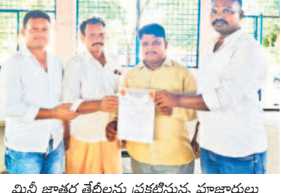
మినీ జాతర తేదీలను ప్రకటిస్తున్న పూజారులు

నాలుగు రోజుల పాటు నిర్వహణ తేదీలు ఖరారు చేసిన పూజారులు