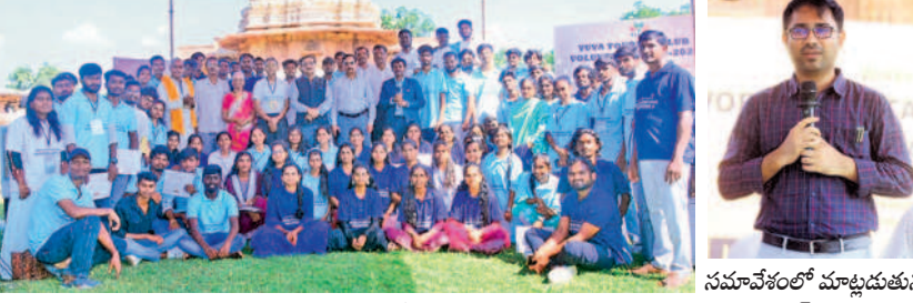
రామచంద్రాప్రోత్సవం పాఠశాలలో అధికారులు కలెక్టర్ దివారక