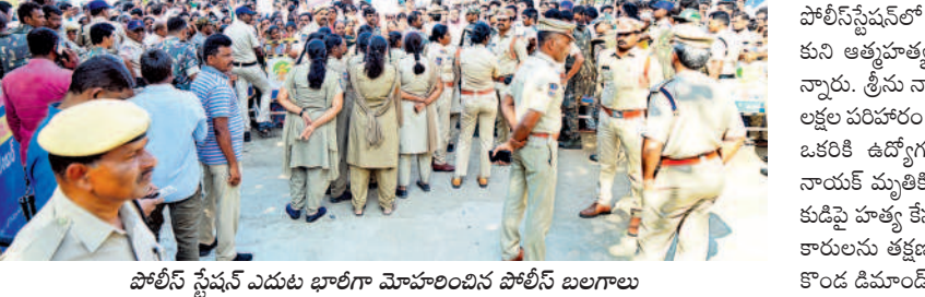
పోలీస్ స్టేషన్ ఎదుట భారీగా మోహరించిన పోలీస్ బలగాలు