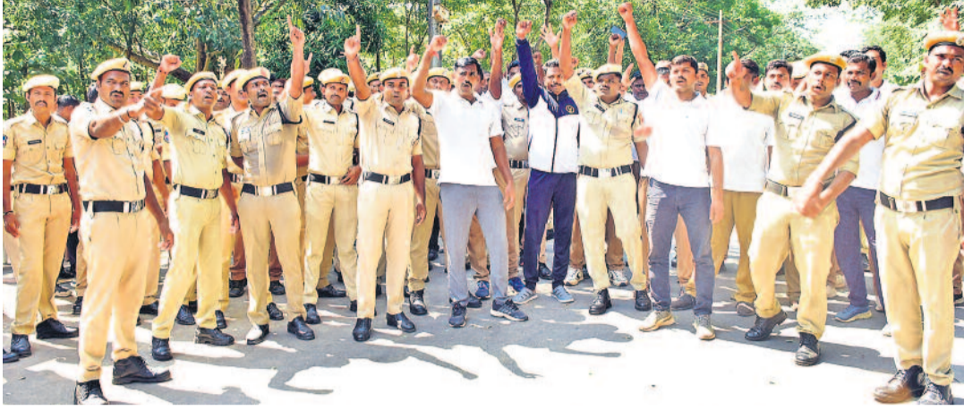
ఏక పోలీస్ కోసం వరంగల్ జిల్లా చూమునూరు బెటాలియన్ లో నిరసనకు దిగిన కానిస్టేబుల్లు

PUBLISHED FROM HYDERABAD • KARIMNAGAR • WARANGAL • KHAMMAM • NALGONDA • MAHABUBNAGAR • NIZAMABAD www.ntnews.com 06 /ntdailyonline