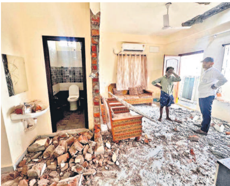
మూసాపేట నర్సల్ పరిధిలోని బాలాజీనగర్ కాలనీ హెచ్ఐజీ-53లో తాళం వేసి ఉన్న ఇంటిని జీహెచ్ఎంసీ అధికారులు చూల్చివేయడంతో దెబ్బతిన్న ఫర్నిచర్

ప్రభుత్వం, డిజిటీ పట్టించుకోకే సచివాలయం ముట్టడి స్వతంత్ర భారత్ లో ఎన్నడూ ఈ ఘోరం చూడలేదు తక్షణమే ప్రభుత్వం పిలిపించి చర్చించి పరిష్కరించాలి పోలీసుల భార్యల ఆందోళనకు బీఆర్ఎస్ సంఘిభావం