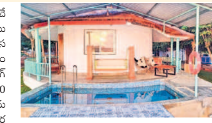
రూముల అటాచ్మెంట్ ఏర్పాటు చేసిన స్విమ్మింగ్ పూల్

పెద్ద స్విమ్మింగ్ పూల్ను నిర్మించారు. కేరళ, లక్ష్మద్వీప్, బాలీలాండ్ల పర్యాటక ప్రాంతాలను పోలిపోయిన విధంగా పర్యాటకులను ఆకర్షించేలా తెలంగాణ పర్యాటక శాఖ ఆధ్వర్యంలో ఫ్రీకోస్ట్ సంస్థ 'దికోవ్' పేరుతో రిసార్టును లీజు పట్టణంలో అందుబాటులోకి తీసుకొచ్చింది. పర్యావరణ హిత టూరిజంగా.. పర్యాటకులను ఆకర్షించేలా 3వ ఐలాండ్లో అధికారులు ఏర్పాటు చేశారు. పర్యావరణ హిత టూరిజంగా అభివృద్ధి చేసే దిశగా 'దికోవ్' రిసార్ట్ మునుపాటిది. స్విమ్మింగ్ పూల్స్, జిప్ లైన్ వంటి అద్వైచర్ గేమ్స్, వాటర్ స్పాట్స్, క్యాంపెయిన్తో పాటు సూతన బోట్తో మినీ బీచ్ ఏర్పాటు చేశారు. పర్యాటకులు సూర్యోదయం, సూర్యాస్తమయాలను మిస్సింపేయకుండా వీలగా వ్యూ పాయింట్ను తీర్చిదిద్దారు. పర్యాటకులు సరదాగా చేపలను వేటాడేందుకు సౌకర్యాలు కల్పించారు. అలాగే సైకిలింగ్ బోటింగ్ను కూడా అందుబాటులోకి తీసుకొచ్చారు. పార్కింగ్, ప్రీ వెడ్జింగ్ షూట్స్, డిస్కస్ థ్రో వేడ్జింగ్ లకు అక్షరం రిసార్ట్ సూతన ఆకర్షణగా మారనున్నది.