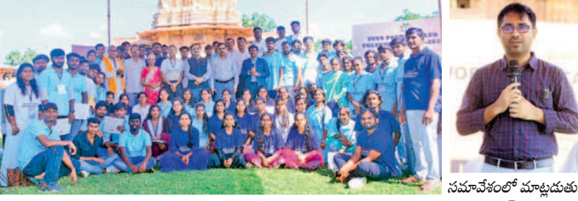
రామచంద్రాప్రోత్సవం పాల్గొని వలంటీర్స్ అధికారులు కలెక్టర్ దివార