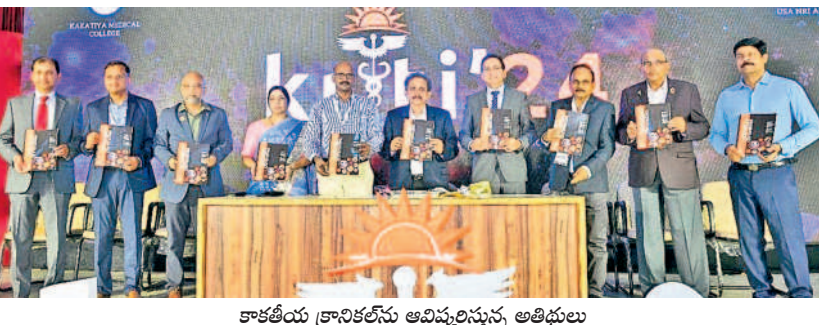
కాకతీయ ట్రానికల్లో అభివృద్ధిపై అతిథులు