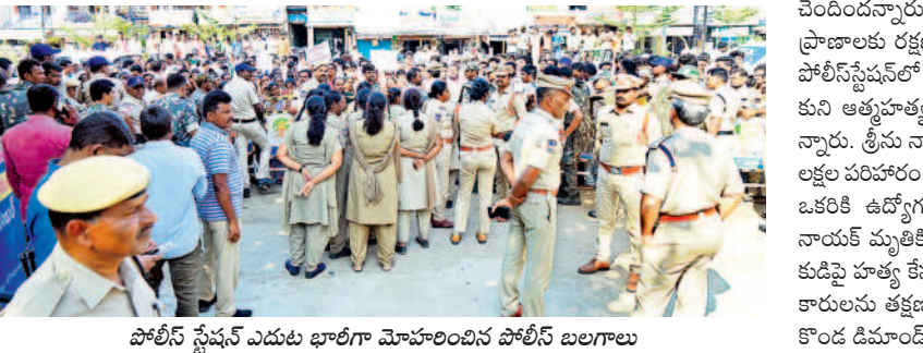
పోలీస్ స్టేషన్ ఎదుట భారతీయ మోహరించిన పోలీస్ బలగాలు