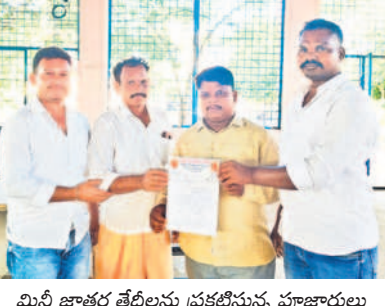
మినీ జాతర తేదీలను ప్రకటిస్తున్న పూజారులు

నాలుగు రోజుల పాటు నిర్వహణ తేదీలు ఖరారు చేసిన పూజారులు