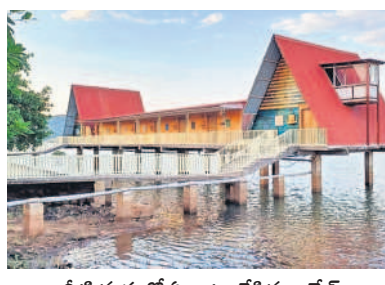
నీటి మధ్యలో ఏర్పాటు చేసిన కాఫీబేలు

పెద్ద స్విమ్మింగ్ పూల్ను నిర్మించారు. కేరళ, లక్ష్మద్వీప్, బాలీలాండ్ల పర్యాటక ప్రాంతాలను పోలిపోయిన విధంగా పర్యాటకులను ఆకర్షించేలా తెలంగాణ పర్యాటక శాఖ ఆధ్వర్యంలో ఫ్రీకోస్ట్ సంస్థ 'దికోవ్' పేరుతో రిసార్టును లీజు పట్టణంలో అందుబాటులోకి తీసుకొచ్చింది. పర్యావరణ హిత టూరిజంగా.. పర్యాటకులను ఆకర్షించేలా 3వ ఐలాండ్లో అధికారులు ఏర్పాటు చేశారు. పర్యావరణ హిత టూరిజంగా అభివృద్ధి చేసే దిశగా 'దికోవ్' రిసార్ట్ మునుపాటిది. స్విమ్మింగ్ పూల్స్, జిప్ లైన్ వంటి అద్వైచర్ గేమ్స్, వాటర్ స్పాట్స్, క్యాంపెయిన్తో పాటు సూతన బోట్తో మినీ బీచ్ ఏర్పాటు చేశారు. పర్యాటకులు సూర్యోదయం, సూర్యాస్తమయాలను మిస్సింపేయకుండా వీలగా వ్యూ పాయింట్ను తీర్చిదిద్దారు. పర్యాటకులు సరదాగా చేపలను వేటాడేందుకు సౌకర్యాలు కల్పించారు. అలాగే సైకిలింగ్ బోటింగ్ను కూడా అందుబాటులోకి తీసుకొచ్చారు. పార్కింగ్, ప్రీ వెడ్జింగ్ షూట్స్, డిస్కస్ థ్రో వేడ్జింగ్ లకు అక్షరం రిసార్ట్ సూతన ఆకర్షణగా మారనున్నది.