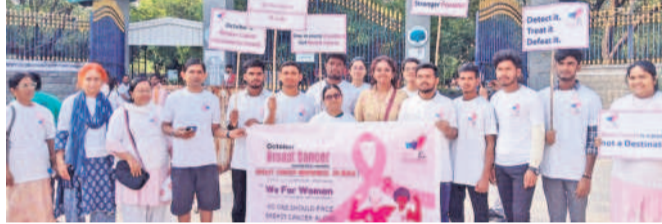
ప్రతియేటా పరీక్షలు చేయించుకోవాలి

ఎనిమిది మందిలో ఒకరు లొమ్మెల క్యాన్సర్ బారిన పడే అవకాశముంది, ముందుగా రిస్క్ ఫ్యాక్టర్లను గుర్తించుకోవాలి. 20 ఏళ్ల వయసులోనే క్యాన్సర్ బారిన పడే అవకాశముంది. ముందుగా రిస్క్ ఫ్యాక్టర్లను గుర్తించుకోవాలి. 20 ఏళ్ల వయసులోనే క్యాన్సర్ బారిన పడే అవకాశముంది. ముందుగా రిస్క్ ఫ్యాక్టర్లను గుర్తించుకోవాలి.