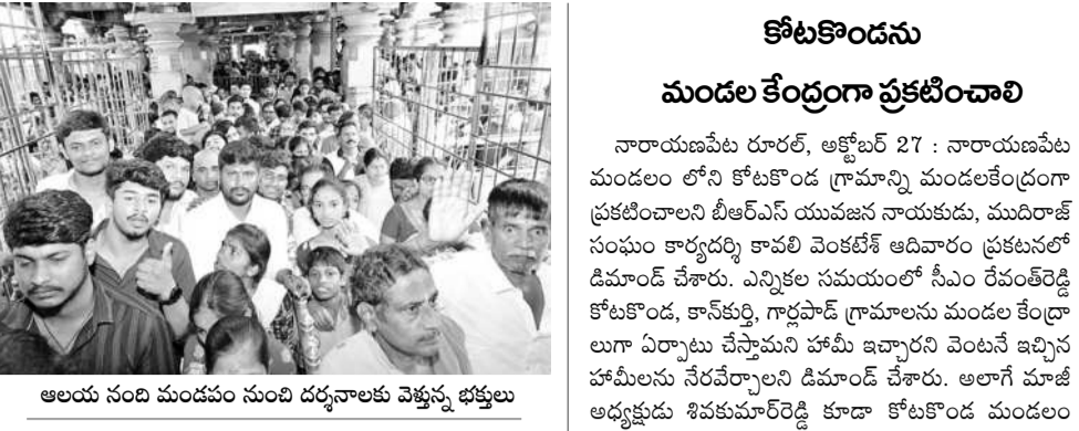
అలయం నంది మండపం నుంచి దర్శనాలకు వెళ్తున్న భక్తులు

మ్యూచువల్ ఫండ్స్ లో పెట్టుబడులు పెట్టాలని మీరు యోచిస్తున్నట్లైతే.. అందుకు ఈ దీపావళియే సరైన సమయమని మెజారిటీ మార్కెట్ నిపుణులు సూచిస్తున్నారు. పైగా కొన్ని రంగాలను పరిశీలించాలని కూడా సూచిస్తున్నారు. వాటిలో మధ్య-చిన్న శ్రేణి బిటీ కంపెనీలు, దేశీయ ఫార్మా సంస్థలు, మెజారిటీ (మేకింగ్, వేస్టింగ్) కార్పొరేట్లకు హాల్మా ర్కెట్లకు వ్యాపారీకరణను కలుపుతూ, వీటిని వేరుగా చెల్లించాల్సి ఉంటుంది. ఇక గతంలో నాలుగైదు సంకేతాలతో హాల్మా ర్కెట్లకు ఉండేది. అందువల్ల మూడుకు తగ్గింది. కాబట్టి పాత హాల్మా ర్కెట్లకు వ్యాపారీకరణను కలుపుతూ, వీటిని వేరుగా చెల్లించాల్సి ఉంటుంది. అందులో హాల్మా ర్కెట్లకు చెందిన కర్షకులు, మేనేజ్మెంట్లు, అమ్మకాల లోబడి ఉన్న వ్యాపారీకరణను కలుపుతూ, వీటిని వేరుగా చెల్లించాల్సి ఉంటుంది. అందులో హాల్మా ర్కెట్లకు చెందిన కర్షకులు, మేనేజ్మెంట్లు, అమ్మకాల లోబడి ఉన్న వ్యాపారీకరణను కలుపుతూ, వీటిని వేరుగా చెల్లించాల్సి ఉంటుంది.