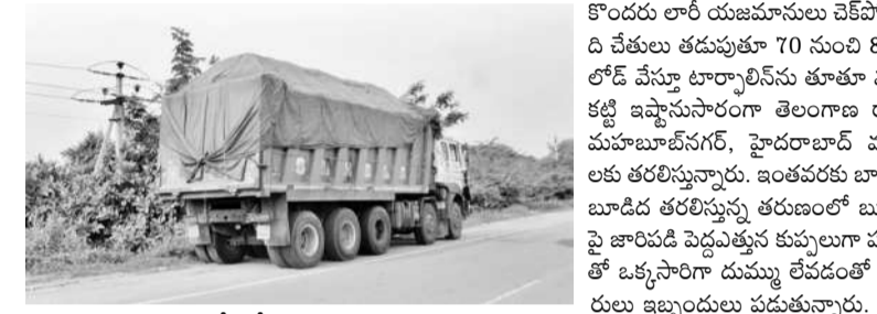
అధికలోడితో వెళ్తున్న బూడిద బీప్పర్

కంట్లో పడి ఆదమలస్తి అంతే సంగతులు జాతీయ రహదారిపై అవస్థలు పడుతున్న వాహనదారులు