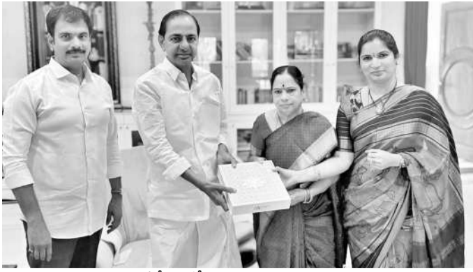
మాజీ సీఎం కేసీఆర్ దంపతులకు పెండ్లి వత్రికను అందజేస్తున్న మాజీ ఎమ్మెల్యే మల్ల దంపతులు