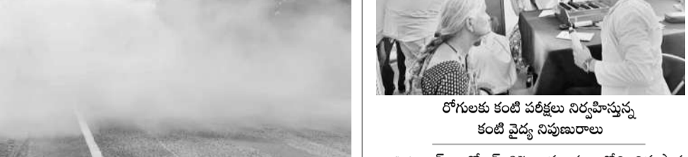
వాహనాలు కూడా కనిపించినంతగా రోడ్డు మొత్తం కమ్మోసిన దుమ్ము

రావు అన్నారు. వివిధ ప్రాంతాల నుంచి శ్రీశైలానికి వచ్చే యాత్రికులతోపాటు స్థానికంగా వ్యాపారాలు చేసుకునే కొందరు దేవస్థాన నిబంధనలను అతిక్రమించడం సమంజసం కాదని హెచ్చరించారు. ఆదివారం దేవస్థానం క్షేత్ర పరిధిలోని పలు ప్రాంతాల్లోని పావులలో తనిఖీలు నిర్వహించిన ఆయన మాట్లాడుతూ పాగాకు పదార్థాలతో పాటు మద్యం వంటివి క్షేత్ర ప్రవేశం చేసేందుకు ప్రయత్నించినా, విక్రయాలు చేసిన వారిపై కఠిన చర్యలు తీసుకుంటున్నామని తెలిపారు.