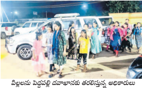
పిల్లలను పెద్దపల్లి దవాఖానకు తరలిస్తున్న అధికారులు