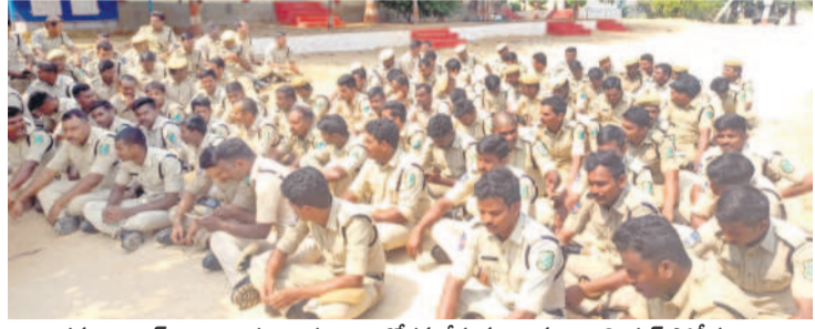
కమాండెంట్ కార్యాలయం ఎదుట అందోళ్ల చేస్తున్న 17వ బెటాలియన్ పోలీసులు

రాజన్న సిరిసిల్ల, అక్టోబర్ 27 (నమస్తే తెలంగాణ): సిరిసిల్ల సర్పాఠాల్లోని 17వ బెటాలియన్ పోలీసులు మళ్లీ అందోళ్లకు దిగాడు. ఏక పోలీస్ విధానాన్ని అమలు చేయాలని డిమాండ్ చేస్తూ రెండ్రోజుల కింద అందోళ్లనే డిమాండ్ చేస్తున్న కొంతమంది అందోళ్లకు అభివారం రోడ్డెక్కారు. వంద మందికికాగా పోలీసు సిబ్బంది బెటాలియన్ అవరణలోని కమాండెంట్ కార్యాలయాన్ని ముట్టడించారు. రోడ్డుపై భైతానియన్ అందోళ్లనే చేశారు. వెళ్లి చాకి చేయిస్తున్న కమాండెంట్ మాకోళ్లు, ఆయన పాలనకు వరమగీతం పాడారు, అతను న్యాయం చేయాలని నినదించారు. ఈ సందర్భంగా వారు మాట్లాడుతూ ఒక రాష్ట్రం, ఒక పోలీస్ విధానం కోసం రాష్ట్ర వ్యాప్తంగా చేపట్టిన అందోళ్లనలో భాగంగా 39 మందిని సస్పెండ్ చేశారు. వారందరినీ తిరిగి విడుదల చేయమంటూ విద్యార్థులతో ముట్టడి చేశారు. సిరిసిల్ల బెటాలియన్ పరిధిలో అరుగురిని సస్పెండ్ చేసినట్లు తెలిపారు.