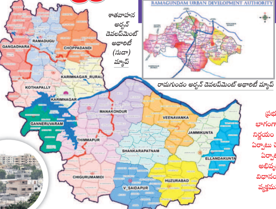
రామగుండం అర్బన్ డెవలప్ మెంట్ అథారిటీ మ్యాప్