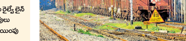
ముణుగూరు వరకు 207 కిలోమీటర్ల పొడవునా సర్వే చేసి, భూ సేకరణ జరపాలని ఉత్తర్వులు జారీ చేసింది. భూపాలపల్లి జిల్లాలోని మల్లెల్ల, భూపాలపల్లి, గణపూరు మండలాలలో పాటు పెద్దపల్లి జిల్లా లోని ముత్తూరు, మంధని, రామగిరి మండలాల పరిధిలో సర్వేను అధిష్ట, సబ్ కలెక్టర్, అడిషనల్ కలెక్టర్లకు ఆదేశాలు జారీ చేసింది.