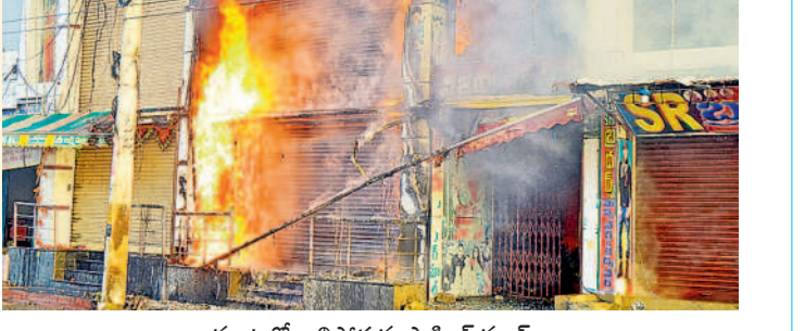
మంటల్లో కాళిపోతున్న షాపింగ్ మార్ట్