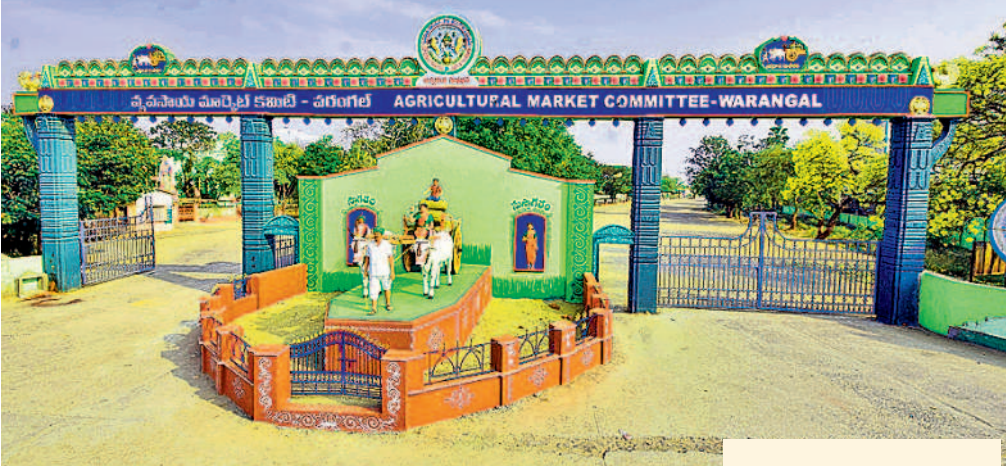
ఎనుమాముల వ్యవసాయ మార్కెట్ ప్రధాన ద్వారం