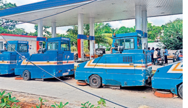
నాలుగు నెలలుగా బల్లియా ప్రధాన కార్యాలయం ఆవరణలో ఉన్న స్వీపింగ్ మిషన్లు

పరంగల్, అక్టోబర్ 27 : గ్రేటర్ కాల్పోరేషన్లోని స్వీపింగ్ మిషన్లు మూలన పడ్డాయి. కోట్లాది రూపాయలు వెచ్చించి కొనుగోలు చేసిన స్వీపింగ్ మిషన్ల నిర్వహణపై అధికార రులు నిర్లక్ష్యం వహిస్తున్నారని. మిషన్ల టెండర్ల ముగిసి నాలుగు నెలలు గడుస్తున్నా పట్టణమంతా పంట లేదు. దీంతో నగర ప్రధాన రహదారులను ఊడ్చే స్వీపింగ్ మిషన్లు బల్లియా కార్యాలయంలో పడి ఉన్నాయి. వీటి వినియోగ బాధ్యతలను ప్రకారాగ్యం విభాగం చూసుకుంటుండగా, టెండర్లను మాత్రం ఇంజనీరింగ్ విభాగం పిలవాల్సి ఉంది. దీంతో రెండు విభాగాల మధ్య సమస్యయ లోపంతో ఈ మిషన్లు మూలన పడ్డాయి. టెండర్లతో నిర్లక్ష్యం స్వీపింగ్ మిషన్ల టెండర్ ముగిసి సుమారు 8 నెలలు గడుస్తున్నా ఇప్పటి వరకు బల్లియా అధికారులు మళ్లీ టెండర్లు పిలువలేదు. దీంతో గ్రేటర్లోని 12 స్వీపింగ్ మిషన్లు మూలన పడ్డాయి. టెండర్లు పొందిన ఏజెన్సీలు వాటి మెయింటెనెన్స్, డ్రైవర్ల వేతనం, వాహనాల రిపేర్లు, డిజిల్ నింపడం తదితర బాధ్యతలను చూసుకుంటాయి. స్వీపింగ్ రూల్స్ మ్యాన్ గో చేస్తూ పని చేయించుకోవడం ప్రకారాగ్యం విభాగం చూసుకుంటుంది. 6 పెద్ద స్వీపింగ్ మిషన్లు, మరో 6 చిన్న మిషన్లు ఉన్నాయి.