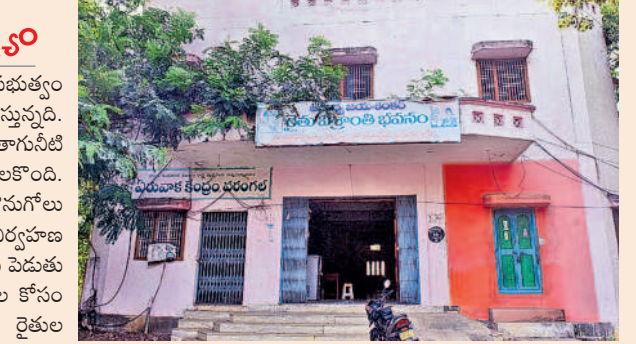
రైతు విశ్రాంతి భవనం

మార్కెట్ నిర్వహణపై ప్రభుత్వం నిర్లక్ష్యంగా వ్యవహరిస్తున్నది. యార్డుల్లో కనీసం రైతులకు తాగునీటి వసతి కల్పించని పరిస్థితి నెలకొంది. దీంతో వాటిల్ల బాటిళ్లు కొనుగోలు చేస్తున్నారు. టాయిలెట్ల నిర్వహణ సరిగా లేదని రైతులు గగ్గోలు పెడుతు న్నారు. ఇక మహిళా రైతుల కోసం ప్రత్యేక ఏర్పాట్లు లేవు. రైతుల విశ్రాంతి భవనం నిర్వహణ కూడా అటవీకేంద్రం. బెడ్స్ ప్యాకెట్ల ఉండగా తాగు నీటి వసతి వసతి లేదు. కొన్ని సందర్భాల్లో రైతులకు బెడ్స్ ప్యాకెట్లతో విశ్రాంతి భవనంలోని గదుల్లో నేలపై పడుకుంటున్నట్లు తెలిసింది. యార్డుల్లో ఎలక్ట్రానిక్ కాంట్రాల్ రైతుల పంట ఉత్పత్తులను తూకం వేయడంలో ఇబ్బంది సమస్య వెంటాడుతోంది. వైపు మెరుగుపరచాలనే ప్రతిపాదన కూడా అమర్చలే తేలేదు. మార్కెట్ నిర్వహణ కోసం ప్రభుత్వం 109 రెగ్యులర్ ఉద్యోగుల పోస్టులను మంజూరు