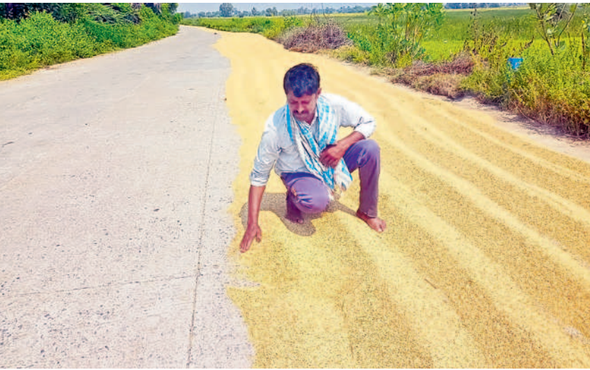
ఉప్పల్లో అరబోసిన సన్నరకం ధాన్యాన్ని చేర్చుతున్న రైతు