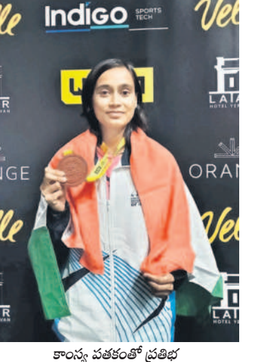
కాంస్య పతకంతో ప్రతిభ

చెనబాక్సింగ్ లో కాంస్య పతకం బిమ్మింద, అక్టోబర్ 28: కామారెడ్డి జిల్లా బిడ్డ అంతర్జాతీయ వేదికపై మెరిసింది. బిమ్మింద మండలం పెద్ద తక్కడెపల్లికి చెందిన ప్రతిభ చెనబాక్సింగ్ లో సత్కారాల్లోని కామారెడ్డి వేదికపై ప్రతిభ చాటి కాంస్య పతకాన్ని సాంఘిక కమిషనరు, పైగా, ఈసారి జరిగిన పోటీల్లో వెయిట్ లేటింగ్ తొలిగించడం వల్ల, తన కన్న అధిక బరువు కేటగిరికి చెందిన ప్రత్యర్థులతోనూ తలపడిన ప్రతిభ ఏమాత్రం వెరువకుండా పరుగు విజయం సాధించింది. చివరకు కాంస్య పతకాన్ని దక్కించుకుంది. పరుగున పతకాలు సాధిస్తున్న ప్రతిభను గ్రామస్థులు అభినందిస్తున్నారు.