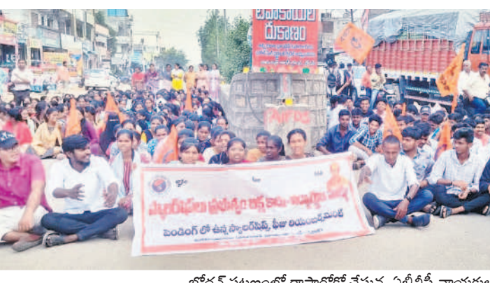
బోధన్ పట్టణంలో రాస్తాకో కో చేస్తున్న ఏబీవీసీ నాయకులు, విద్యార్థులు