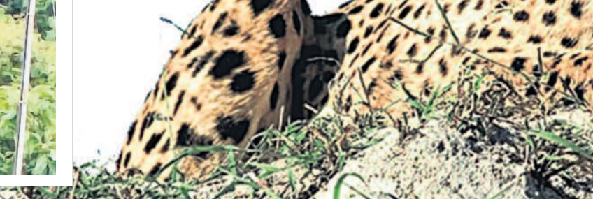
అటవీ జంతువుల గణన చేయడం వల్లి వాటి సంఖ్య పెరిగిందనే చెప్పవచ్చు.

ఇదేండ్లకోసారి గణన.. చిరుతలు గ్రామీణ ప్రాంతాలకు రావడం, మూగ జీవాలపై దాడులు చేయడం వల్లి వాటి సంఖ్య పెరిగిందనే చెప్పవచ్చు. అయితే ఈ విషయానికొస్తే అధికారి ద్వారా వివరాలు సేకరించడం గత నాలుగేండ్ల క్రితం ఉన్న 70 చిరుత పులుల సంఖ్య ఇప్పుడు సుమారు 100 కు చేరిందని చెప్పుకు వచ్చారు. అంటే నాలుగేండ్ల క్రితం పరకు ఉన్న చిరుత పులుల సంఖ్యను బట్టి మాస్త్రీ యాభై శాతం చిరుతలు వృద్ధి చెందినట్లు గుర్తించారు. చిరుతలు గ్రామీణ ప్రాంతాలకు రావడం, మూగ జీవాలపై దాడులు చేయడం వల్లి వాటి సంఖ్య పెరిగిందనే చెప్పవచ్చు. అయితే ఈ విషయానికొస్తే అధికారి ద్వారా వివరాలు సేకరించడం గత నాలుగేండ్ల క్రితం ఉన్న 70 చిరుత పులుల సంఖ్య ఇప్పుడు సుమారు 100 కు చేరిందని చెప్పుకు వచ్చారు. అంటే నాలుగేండ్ల క్రితం పరకు ఉన్న చిరుత పులుల సంఖ్యను బట్టి మాస్త్రీ యాభై శాతం చిరుతలు వృద్ధి చెందినట్లు గుర్తించారు.