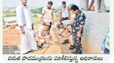
చిరుత పాదముద్రలను పరిశీలిస్తున్న అధికారులు