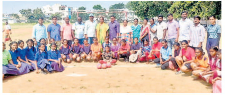
ఎంపికైన ఉమ్మడి నల్లగొండ జిల్లా హ్యండ్ బాల్ సో బోయింగ్ బాలికల జట్టు

అని కలెక్టర్ ఇలా త్రిపాఠి ఆయా శాఖల అధికారులను ఆడిశించారు. తన చాంబర్లో పౌర సరకీయ, కుల సమగ్ర ఇంటిలో సర్వేను పకడ్బందీగా నిర్వహించాలని సూచించారు. ఉదయాదిత్య భవన్లో మంగళవారం ఆయా అంశాలపై నిర్వహించిన సమావేశంలో ఆమె పాల్గొని మాట్లాడారు. మార్కెట్ స్ట్రీటులపై అన్ని అంశాలపై ప్రత్యేక శ్రద్ధ వహించి క్రమంగా తెలుసుకుంటున్నారని, శిక్షణలో నేర్చుకున్న అంశాలను మండల స్థాయిలో ఎన్యుమరేటర్లకు చెప్పి క్షేత్ర స్థాయిలో పకడ్బందీగా సర్వే చేపట్టాలని తెలిపారు. వివరాల సేకరణ అనంతరం డేటా ఎంట్రీ నిర్వహించాలన్నారు.