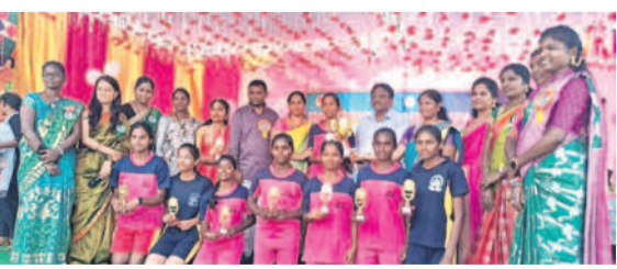
మిర్యాలగూడ రూరల్ : విజేతల బహుమతులు అందిస్తున్న టీసీ గురుకుల ఎజిజి. లింగయ్య

ఖోఖోలో విన్సెన్ట్లో దామరచర్ల గురుకులం, రన్నర్స్ గా మోటకొండ గురుకులం, వాలిబాల్లో విన్సెన్ట్ గా అనంతగిరి గురుకులం, రన్నర్స్ గా నల్లగొండ గురుకులం, వాలిబాల్లో విన్సెన్ట్ గా అనంతగిరి గురుకులం, రన్నర్స్ గా పలిగొండ గురుకులం, చెన్నెలో విన్సెన్ట్ గా తుమ్మడ గురుకులం, రన్నర్స్ గా చందంపేట గురుకులం విద్యార్థులు నిలిచారు. 17 బహుమతులు గెలుచుకొని ఓవరల్ చాంపియన్ గా మునుగోడు గురుకులం పాఠశాల విద్యార్థులు నిలిచారు. వ్యక్తిక చాంపియన్ గా పి.వై.వి. నిలిచినట్లు నిర్వాహకులు తెలిపారు.