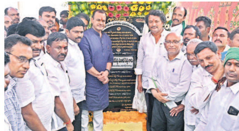
పగడిమిలో అభివృద్ధి పనులకు శంకుస్థాపన చేస్తున్న మంత్రి కోమటిరెడ్డి వెంకటరెడ్డి