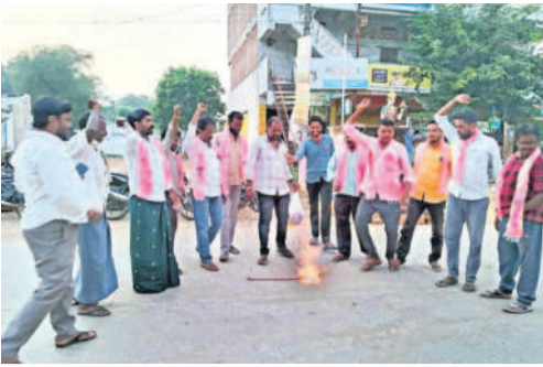
నూతనకల్ మండల కేంద్రంలో పటాకులు కాల్చి హర్షం వ్యక్తం చేస్తున్న బీఆర్ఎస్ శ్రేణులు

విద్యుత్ చార్జీలను పెంచి ప్రభుత్వం ప్రజలపై వేయాలనుకున్న రూ. 18,500 వేల కోట్ల భారాన్ని ఆపడంలో తమ పార్టీ విజయం సాధించిందని బీఆర్ఎస్ నాయకులు హర్షం వ్యక్తం చేశారు. ఈ సందర్భంగా జిల్లాలోని పలు చోట్ల పటాకులు కాల్చి సబురాలు చేసుకున్నారు. మాజీ మంత్రులు కేటీఆర్, జగదీశ్వర్ రెడ్డితోపాటు ఎమ్మెల్యేల పోరాటం, వినకులతో ప్రభుత్వం, ఈ ఆర్ఎస్ విద్యుత్ చార్జీల పెంపు నిర్ణయంపై వెనక్కి తగ్గిందని తెలిపారు.