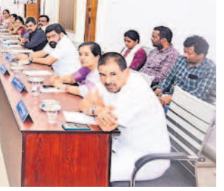
అభివృద్ధి పనులపై చర్చిస్తున్న అమీన్ పూర్ మున్సిపల్ పాలకవర్గ సభ్యులు