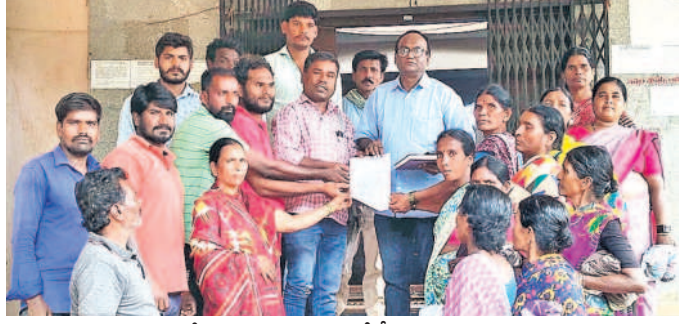
కమిషనరీ ఉమామహేశ్వరరావుకు సమ్మె నోటీసు అందడంపై నాయకులు, కార్మికులు

ఇంటింటి సర్వే పకడ్బందీగా నిర్వహించాలి. ఇంటింటి సర్వే పకడ్బందీగా నిర్వహించాలి.