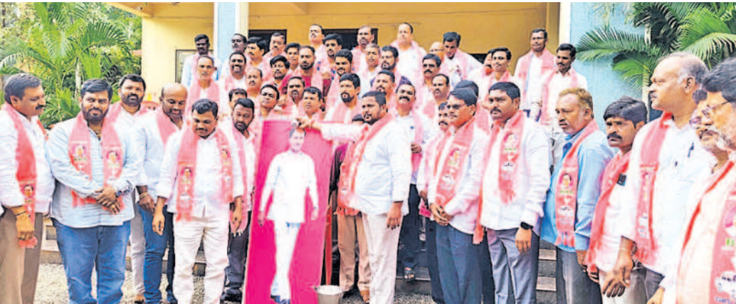
జమ్మిరాబాద్ ఎమ్మెల్యే కార్యాలయంలో కేసీఆర్ చిత్రవటానికి క్షీరాభిషేకం చేస్తున్న బీఆర్ఎస్ శ్రేణులు