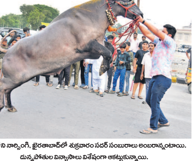
నగరంలోని నార్సింగ్, ఖైరతాబాద్లో శుక్రవారం సడర్ సంబురాలు అంబరాంతాయి. దునిపోతుల విన్నాసాలు విశేషంగా ఆకట్టుకున్నాయి.