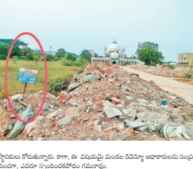
స్థానికులు కోరుతున్నారూ. కాగా, ఈ విషయమై మండల రెవెన్యూ అధికారులను సంప్రదించగా, ఎవరూ స్పందించకపోవడం గమనార్హం.

దుండిగల్: కుత్బుల్లూర్ నియోజకవర్గం పరిధి, గండిమెనమ్మ-దుండిగల్ మండల పరిధిలో కోట్ల రూపాయల విలువైన ప్రభుత్వ భూములు అన్యాయాత్మకమవుతున్నాయి. రెవెన్యూ అధికారులు పట్టించుకోవడం లేదు. సర్కారు స్థలాల కబ్జాకు గురవుతున్నాయి. అటువైపు కన్నెత్తి చూడడం లేదు. కనీసం ప్రజలు ఫిర్యాదు చేసినా.. చూసినాడనట్లు వ్యవహరిస్తున్నారన్న ఆరోపణలు వినిపిస్తున్నాయి. ఫలితంగా మండల పరిధిలోని ప్రభుత్వ భూములు, చెరువులు, కుంటలు మాయమవుతున్నాయని ప్రజలు ఆవేదన వ్యక్తం చేస్తున్నారు. తాజాగా మండల రెవెన్యూ కార్యాలయంలోని వెళ్లెదారిలోని వండల కోట్ల విలువైన ప్రభుత్వ భూమిలో అక్రమార్కులు మట్టిని నింపి.. చదును చేస్తున్నా అధికారులు పట్టించుకోవడం లేదని స్థానికులు ఆరోపిస్తున్నారు. గండిమెనమ్మ-దుండిగల్ మండలం, దొమ్మరపాపపల్లి గ్రామం, సర్వే నంబర్ 120/24 ప్రభుత్వ భూమిలో కొన్ని రోజులుగా కొందరు వ్యక్తులు వండలారి టిప్పర్ ద్వారా మట్టిని వేస్తూ.. జీసీసీలో చదును చేస్తున్నారని స్థానికులు పేర్కొంటున్నారు. కంటోన్మెంట్ పరిధిలో 2011 జనాభా లెక్కల ప్రకారం 2,17,910 మంది ప్రజలు నివాసముండగా, ప్రస్తుతం దాదాపు 4 లక్షల మంది ఉన్నట్లు కంటోన్మెంట్ బోర్డు అంచనా.