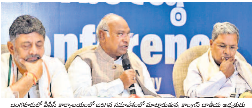
బెంగళూరులో పీసీసీ కార్యాలయంలో జరిగిన సమావేశంలో మాట్లాడుతున్న కాంగ్రెస్ జాతీయ అధ్యక్షుడు మల్లికార్జున్ ఖర్గే. చిత్రంలో కర్ణాటక సీఎం సిద్ధరామయ్య, డిప్యూటీ సీఎం డీకే శివకుమార్ > 7

రాష్ట్ర బడ్జెట్ కు లోబడే హామీలను ప్రకటించాలి లేకుంటే భవిష్యత్తు తరాలు నష్టపోతాయి: ఖర్గే