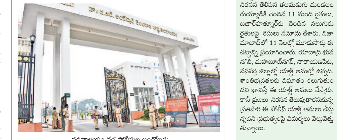
నవిచాలయం వద్ద పోలీసుల బందోబస్తు

వైఎస్ఆర్ కమ్యూనిటీ కేంద్రం నేలను సమీక్షించారు. రాష్ట్రవ్యాప్తంగా పోలీస్ యాక్టివ్ అమలు చేసే దిశగా అడుగులు వేస్తున్నది. అసంబద్ధ నిర్వహణతో రాష్ట్రంలోని అన్ని పోలీస్ స్టేషన్లలోని అన్ని పోలీసులను మింగి సిన కాంగ్రెస్.. ఇప్పుడు ప్రశ్నించే హక్కును కాలానించుకున్నట్లు ప్రకటించింది. ఇప్పటికే హైదరాబాద్ లో 144 సెక్షన్ అమలులో ఉండగా.. జిల్లాలోని పోలీస్ యాక్టివ్ అమలు చేస్తున్నది. సంగారెడ్డి జిల్లాలో ఈ నెల మొత్తం పోలీస్ యాక్టివ్ అమలు చేస్తున్నట్లు ఎస్సీ రూమ్స్ శుక్రవారం ఉత్తరాలను జారీచేశారు. కామారెడ్డి జిల్లాలో ఈ నెల 7 వరకు పోలీస్ యాక్టివ్ అమలు చేస్తున్నారు. కాంగ్రెస్ ప్రభుత్వం ఇప్పటివరకు అధికారికంగా 13 జిల్లాల్లో పోలీస్ యాక్టివ్ అమలు చేసినట్లు ప్రకటించింది. మిగతా జిల్లాల్లోనూ త్వరలో పోలీస్ రాజ్యం మొదలయ్యే అవకాశం ఉన్నట్లు హెచ్చరికలు చేస్తున్నారు. అప్పుడు చట్టాన్ని బాగా చూపి ప్రశ్నించే ప్రతి గొంతుకునూ అడ్డుకుంటుంది చెప్పారు.