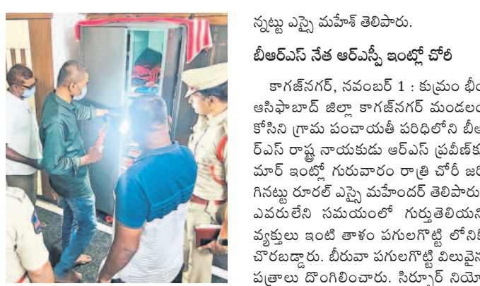
నిజామాబాద్ లో చోరీ జరిగిన ఓ ఇంట్లోని బీరువాను పరిశీలిస్తున్న పోలీసులు