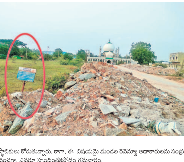
స్థానికులు కోరుతున్నారని. కాగా, ఈ విషయమై మండల రెవెన్యూ అధికారులను సంప్రదించగా, ఎవరూ స్పందించకపోవడం గమనార్హం.

దుండిగల్: కుత్బుల్లూర్ నియోజకవర్గం పరిధి, గండిమెనమ్మ-దుండిగల్ మండల పరిధిలో కోట్ల రూపాయల విలువైన ప్రభుత్వ భూములు అన్యాయాత్మకముగా.. రెవెన్యూ అధికారులు పట్టించుకోవడం లేదు. సర్కారు స్థలాల కబ్జాకు గురవుతున్నా.. అటువైపు కన్నెత్తి చూడడం లేదు. కనీసం ప్రజలు ఫిర్యాదు చేసినా.. చూసినాడనట్లు వ్యవహరిస్తున్నారన్న ఆరోపణలు వినిపిస్తున్నాయి. ఫలితంగా మండల పరిధిలోని ప్రభుత్వ భూములు, చెరువులు, కుంటలు మాయమవుతున్నాయని ప్రజలు ఆవేదన వ్యక్తం చేస్తున్నారు. తాజాగా మండల రెవెన్యూ కార్యాలయంలోని వందల కోట్ల విలువైన ప్రభుత్వ భూమిలో అక్రమార్కులు మట్టిన నింపి.. చదును చేస్తున్నా అధికారులు పట్టించుకోవడం లేదని స్థానికులు ఆరోపిస్తున్నారు. గండిమెనమ్మ-దుండిగల్ మండలం, దొమ్మరపాపపల్లి గ్రామం, సర్వే నంబర్ 120/24 ప్రభుత్వ భూమిలో కొన్ని రోజులుగా కొందరు వ్యక్తులు వందలాది టీపుర్ర ద్వారా మట్టిని వేస్తూ.. జీసీసీతో చదును చేస్తున్నారని స్థానికులు పేర్కొంటున్నారు. కంటోన్మెంట్ పరిధిలో 2011 జనాభా లెక్కల ప్రకారం 2,17,910 మంది ప్రజలు నివాసముండగా, ప్రస్తుతం దాదాపు 4 లక్షల మంది ఉన్నట్లు కంటోన్మెంట్ బోర్డు అంచనా.