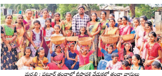
మర్నాటి: పట్టణం తండాలో దీపావళి చేపట్టే తండా వాసులు

రెడ్డి, కుటుంబసంఘాలందరితో తమ కుటుంబసంఘాలతో కలిసి దీపావళి సందర్భంగా బాణాసంచా కాలార్లు.