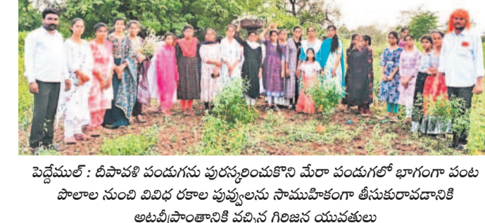
పెద్దముల్: దీపావళి పండుగను పురస్కరించుకొని మేరా పండుగలో భాగంగా పంట పొలాల నుంచి వివిధ రకాల పువ్వులను సామూహికంగా తీసుకురావడానికి అటవీప్రాంతానికి వచ్చిన గిరిజన యువకులు