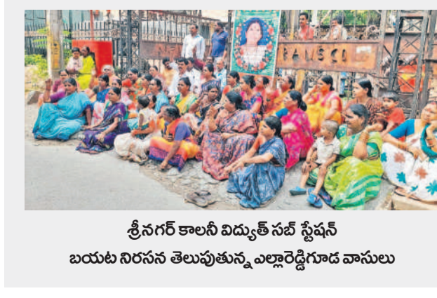
శ్రీనగర్ కాలనీ విద్యుత్ సబ్ స్టేషన్ బయట నిరసన తెలుపుతున్న ఎల్లారెడ్డిగూడ వాసులు