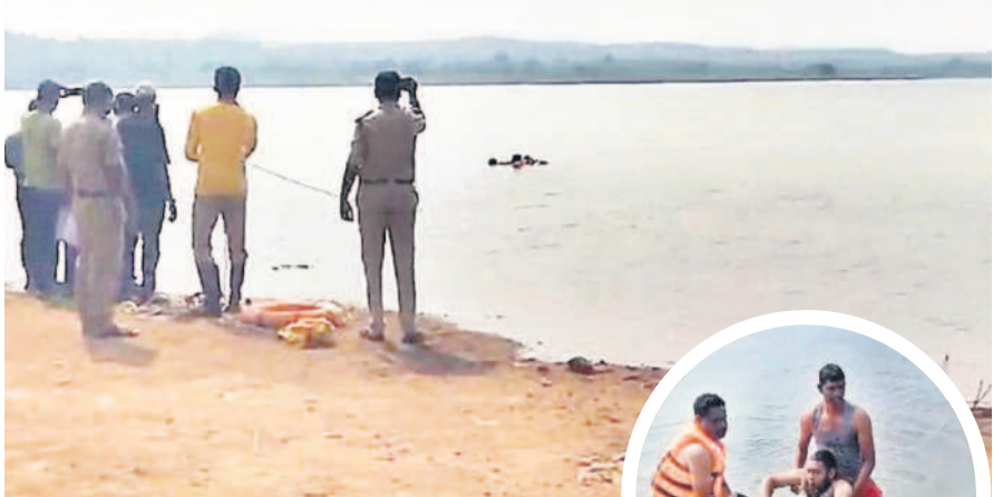
చెరువులో మృతదేహాలను చలశిలిస్తున్న పోలీసులు, మృతదేహాలను బయటికి తీసుకువచ్చును రెస్క్యూ టీం

తెగబడి రైతులను ముంచేస్తున్నారు. నిజామాబాద్లో 480 కొనుగోలు కేంద్రాల ద్వారా సుమారు 8 లక్ష మెట్రిక్ టన్నులు సేకరించాలని లక్ష్యంగా పెట్టుకున్నప్పటికీ, వ్యాపారులు కొరబడి ఇన్వెంటరీ ధాన్యాన్ని సేకరిస్తున్నారు. చాలావౌట్ల అక్టోబర్ నెలంబాటు సుంచి క్వింటాలు రూ.2వేల లోపే చెల్లింపులు చేస్తున్నారు. మద్దతు ధర దక్కకపోవడంతో చాలా మంది రైతులు దిగాలు చెందుతున్నారు. ప్రభుత్వ తీరుపై మండిపడుతున్నారు. మద్దతు ధరకు రైస్ మిల్లర్లు మంగళం పాడుతున్నప్పటికీ పట్టించుకునే నాణ్యత లేకపోవడం గమనార్హం.