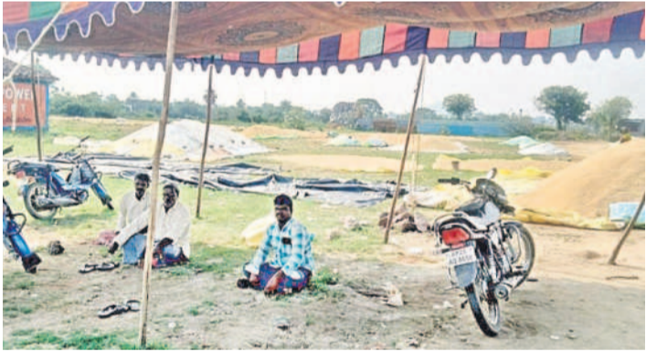
కొనుగోలు చేస్తారని వచ్చి టెంట్ కింద కూర్చున్న రైతులు