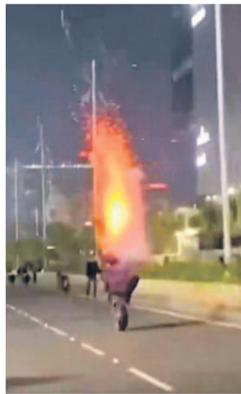
సోషల్ మీడియాలో వీడియో వైరల్ యువకుడిపై కేసు నమోదు

శేరిలింగంపల్లి, నవంబర్ 3: మాదాపూర్ కేబుల్ బ్రీడ్లింగ్ బ్లక్ విద్యుత్ సౌకర్యం చేస్తూ.. వచ్చి ఇంటి కోశిసూర్ వద్ద రహదారిపై పటాకులు కాల్చి సోషల్ మీడియాలో వీడియో పోస్ట్ చేసి హాల్చల్ చేసిన ఓ యువకుడిపై రాయదుర్గం పోలీసులు కేసు నమోదు చేశారు. సోషల్ మీడియాలో వైరల్ లోగా మారిన వీడియోను సైబరాబాద్ పోలీసులు సీరియస్ గా తీసుకున్నారు. వాహనాలతో రద్దీగా ఉండే కేబుల్ బ్రీడ్లింగ్ ప్రమాదకర స్థాయిలో బ్లక్ విద్యుత్ సౌకర్యం చేయడంతో పాటు పక్కనే ఉన్న ఇంటి కోశిసూర్ వద్ద రోడ్డుపై ప్రమాదకర స్థాయిలో బాణాసంచా కాల్చి.. విద్యుత్ సౌకర్యం చేసి సోషల్ మీడియాలో వీడియోను వైరల్ చేశారు. ఈ వ్యవహారాన్ని సీరియస్ గా తీసుకున్న రాయదుర్గం పోలీసులు సదరు యువకుడిపై కేసు నమోదు చేశారు. ఇన్స్టాగ్రామ్లో ఘటన ప్రాంతానికి చెందిన యువకుడు ఈ వీడియోను పోస్ట్ చేసినట్లు గుర్తించారు. సదరు బ్లక్ నుండి రోడ్ పక్కన ఉన్న నిందితుడి కచ్చితమైన అవకాశం అభ్యంతరాలే రాదు యువకుడిపై తెలిపారు. సదరు యువకుడిపై బీఎన్ఎస్ఐసీ 121 సెక్షన్ కింద ఆదారం చేసు నమోదు చేసి దర్యాప్తు చేపట్టినట్లు చెప్పారు.