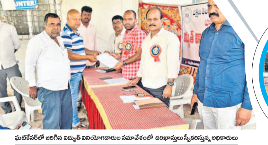
ఘటనలో జరిగిన విద్యుత్ వినియోగదారుల సమావేశంలో దరఖాస్తు స్వీకరిస్తున్న అధికారులు